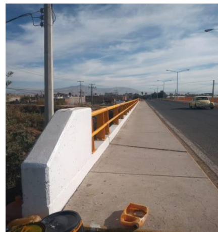
PINTURA EN SUPERFICIES DE CONCRETO