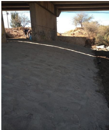
ZAMPEADO DE MAMPOSTERÍA DE TERCERA CLASE