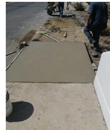
BANQUETA DE CONCRETO HIDRÁULICO REFORZADO