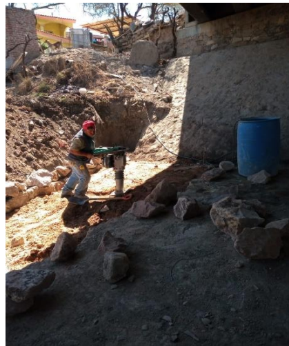
RELLENO PARA ZAMPEADO