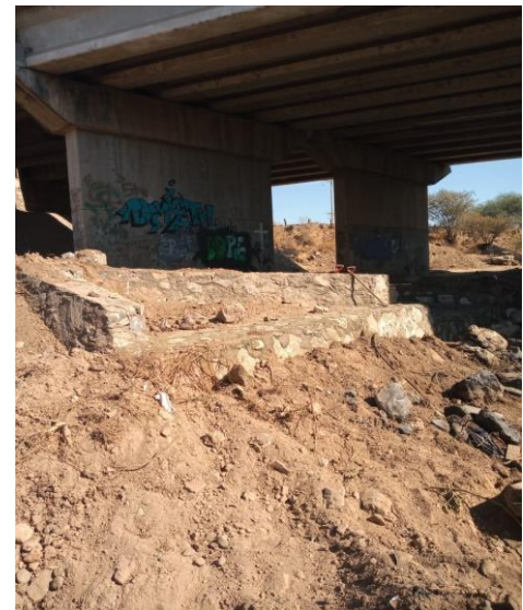
ARROPE DE TALUDES