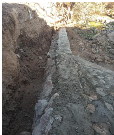
MAMPOSTERIA DE PIEDRA DE TERCERA CLASE