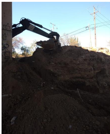
EXCAVACION DE TERRENO NATURAL