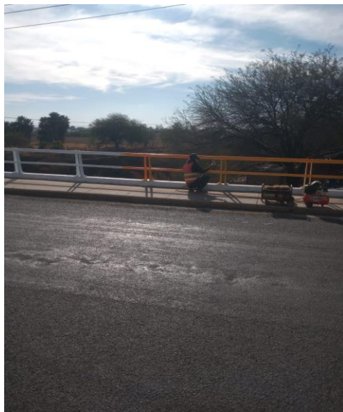
PINTURA EN SUPERFICIES METÁLICAS