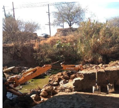
DEMOLICION DE MAMPOSTERIA