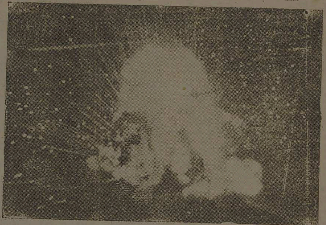
Vemos acima a base aeronaval japonesa de Palau, no Pacífico Central, sofrendo os efeitos do destruidor ataque combinado das forças navais e aéreas dos Estados Unidos. (Foto do S. I. H.).