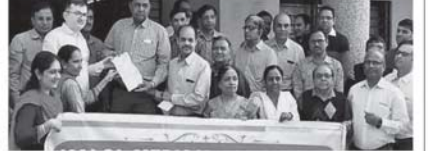
કલોલ મેડિકલ એસો. દ્વારા બ્લેક ડે ઉજવવામાં આવ્યો હતો. જેમાં મેડી સંખ્યામાં ડોક્ટર હાજર રહ્યાં હતાં.

કલોલ મેડિકલ એસો. દ્વારા બ્લેક ડે ઉજવવામાં આવ્યો હતો. જેમાં મેડી સંખ્યામાં ડોક્ટર હાજર રહ્યાં હતાં. આજરોજ રાત્રી ૭ થી સવાર ૬ વાગ્યાં સુધી ૭૫ રાજીવ ગાંધી સિવિલ સર્જન કેન્દ્રે ૭૫ દર્દીઓને હાલાકી વેઠવી પડી હતી. ૭૦ દર્દીઓને મેડિકલ ક્ષેત્રમાં હડતાળ પર ઉત્તર કર્યા. અને કોરોના જેવી કાઠી સારવાર રોડ કિલ્લાર માને પાંચવીં વિરોધ દર્શાવેલું નુકસાન કર્યું હતું.