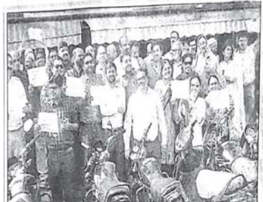
ગોધરામાં રજુ થયેલ એનએમસી બીજા સીટિંગ કેન્દ્ર સરકારની નીતિના વિરોધમાં આજરોજ દાહોના સિવિલ સર્જન નવા તબીબ સંગઠનના સભ્યોએ મેડિકલ ક્ષેત્રમાં હડતાળ પર ઉત્તર કર્યા. અને કોરોના જેવી કાઠી સારવાર રોડ કિલ્લાર માને પાંચવીં વિરોધ દર્શાવેલું નુકસાન કર્યું હતું.