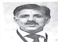
Roy Abraham Kallivayalil, secretary general, World Psychiatric Association.

Costly medical education — "The Bill paves the way for corruption as it removes all regulations for setting up a medical college. As per its provisions, the government can regulate the fee structure of only up to 40% of the seats at a private medical college. The management will fix the fee structure for the remaining 60%. This will definitely make medical educa-