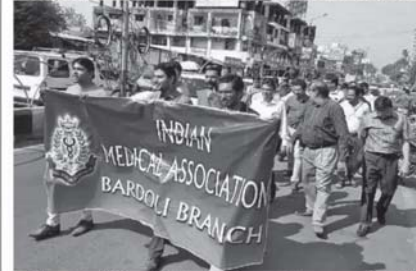
આરડોલી નગરમાં આઈએમએ આરડોલીના પ્રમુખ ડોક્ટરોએ હડતાળમાં જોડાયા હતા. આ સાથે આરડોલીના મુખ્ય માર્ગ પર રેલી કાઢી વિરોધ પ્રદર્શન પણ કર્યું હતું.