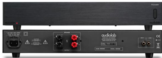
Audiolab 8200P Audiolab 8200M