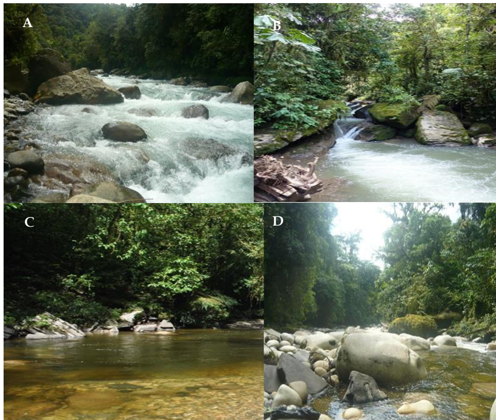
Figura 2. Figura compuesta. A: Microcuenca del río Zuñag (MRZ), zona de amortiguamiento del corredor Ecológico Llanganates-Sangay. B: Micruenca del río Tigre (MRT), zona de amortiguamiento del corredor Ecológico Llanganates-Sangay. C: Micruenca del río Alpayacu (MRAYP), zona de amortiguamiento del corredor Ecológico Llanganates-Sangay. D: Micruenca del río Anzu (MRA), zona de amortiguamiento del corredor Ecológico Llanganates-Sangay.

Microcuenca del Río Alpayacu (MRAYP) (-78.10607274°, -1.435327416°), a los 1 100 m snm (Fig. 2C). Es un río de montaña localizado en los Bosques selváticos de los Llanganates. Sus aguas son claras con cantos rodados pequeños y medianos, la profundidad es de 30 cm a 2 m y el ancho varía entre 4 a 5 m. En ambas orillas hay presencia de limos finos y arenas blancas. La temperatura ambiente fue 31,6 °C. La vegetación de las orillas incluyó Bosque secundario intervenido y pequeños potreros para ganado.