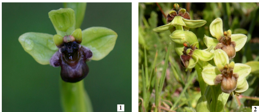
Figuras 1 y 2. Ophrys bombyliflora Link. 1. Puntales, P.N. Marismas del Odiel (Huelva). 2. Entre El Rocío-El Alamillo (Almonte), Espacio Natural Doñana.