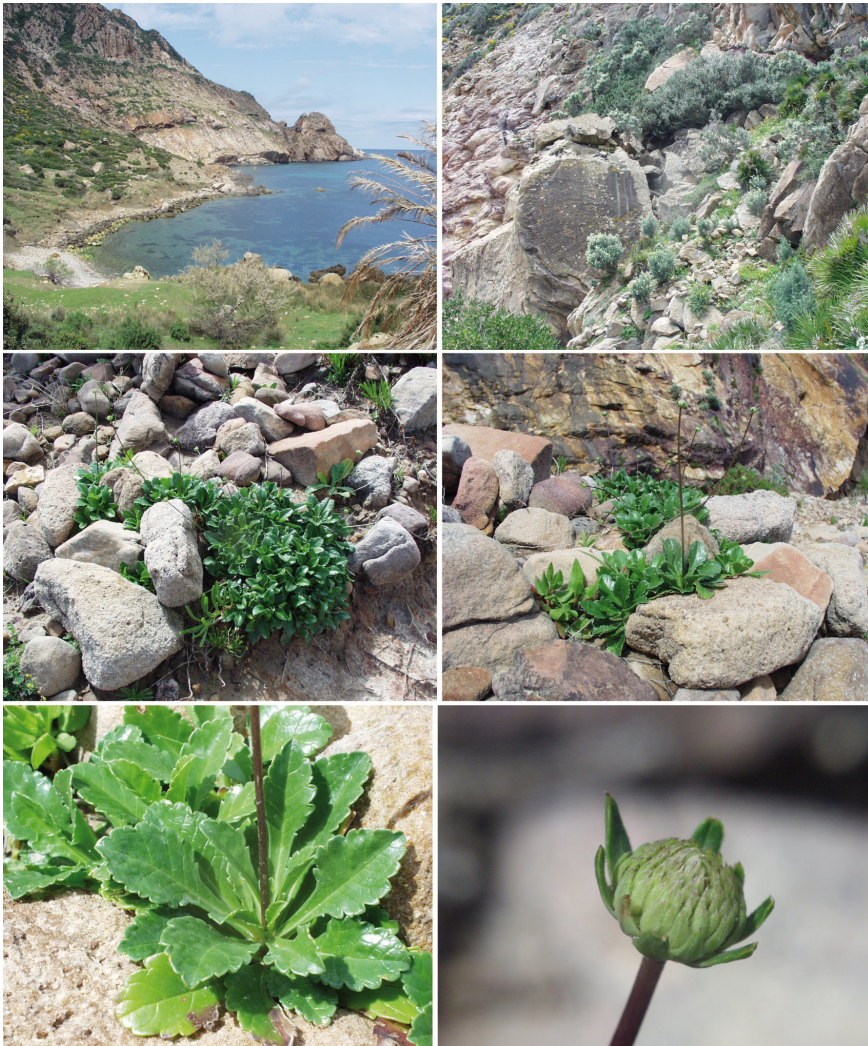
Fig. 1. Sixalix farinosa (Coss.) Greuter & Burdet en début de floraison dans sa localité algérienne du Cap Sigleb (ex-Cap Roux) à Oum Teboul (wilaya d'El Tarf).

vicariant Lotus cytisoides subsp. cytisoides peut paraître un peu surprenante dans le contexte local. Afin de compléter nos maigres photographies de la plante in situ, nous adjoignons à notre travail une reproduction (Fig. 3) de l'excellente planche 135 publiée par COSSON & BARRATTE (1893-1897).