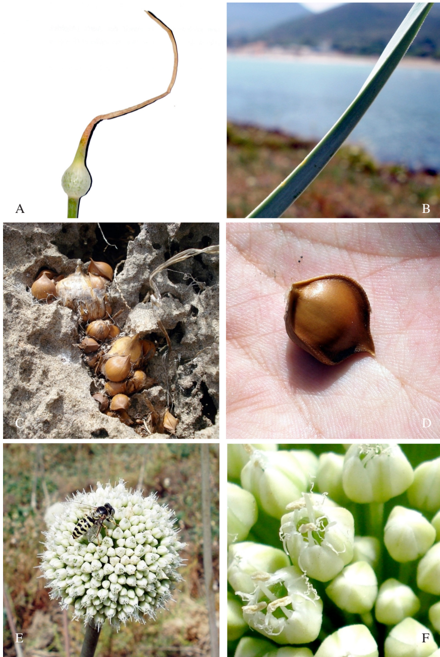
Fig. 1. Allium commutatum Guss., "îlot à l'ail", Boulimite, Bejaia, Algérie: A, spathe récoltée sur l'îlot; B, limbes foliaires; C, bulbes et caïeux incrustés dans la roche; D, détail d'un caïeux avec papilles (flèche); E, inflorescence avec pollinisateur; F, détail de la fleur avec dents staminodales latérales.