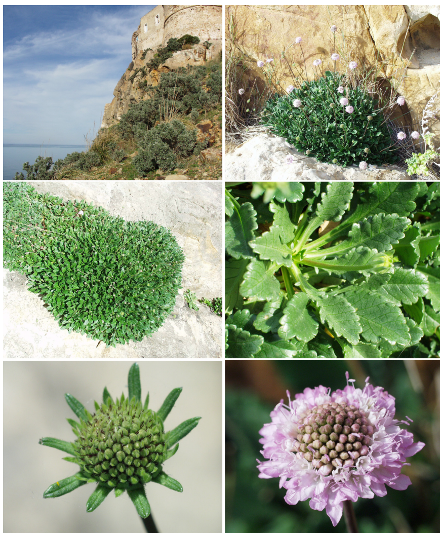
Fig. 2. Sixalix farinosa (Coss.) Greuter & Burdet en début de floraison dans sa localité tunisienne du fort de Tabarka (gouvernorat de Jendouba), en compagnie d' Anthyllis barba-jovis L.

espèces (QUÉZEL & SANTA, 1962-1963; POTTIER-ALAPETITE, 1979 ;1981); Bunium crassifolium (Batt.) Batt. [= B. mauritanicum var. crassifolium Batt.]; Centaurea papposa (Coss.) Greuter [= C. gymnocarpa var. papposa Coss. = C. cineraria var. gymnocarpa auct.]; Genista aspalathoides Lam. [sensu stricto]. Ainsi, la découverte de Sixalix farinosa en Algérie nord-orientale, si elle confirme l'intérêt toujours plus grand de cette région encore mal explorée, n'est point surprenante sur le plan biogéographique, et d'autres découvertes du même ordre pourraient ainsi encore voir le jour.