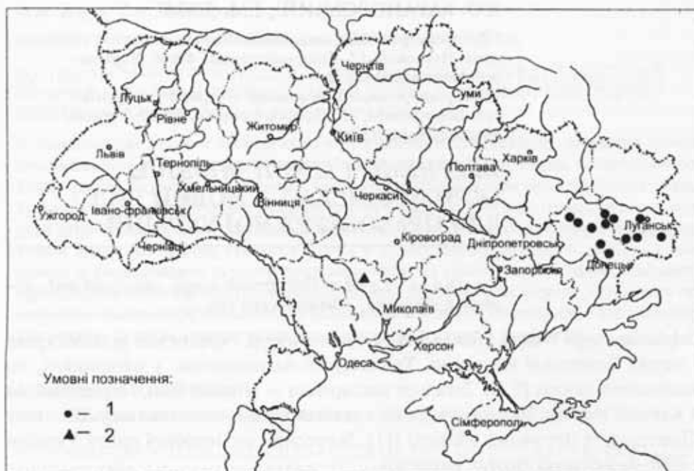
Рис. 1. Ареал розповсюдження Delphinium sergii Wissjul.: 1 — місцезнаходження за літературними даними; 2 — нове місцезнаходження