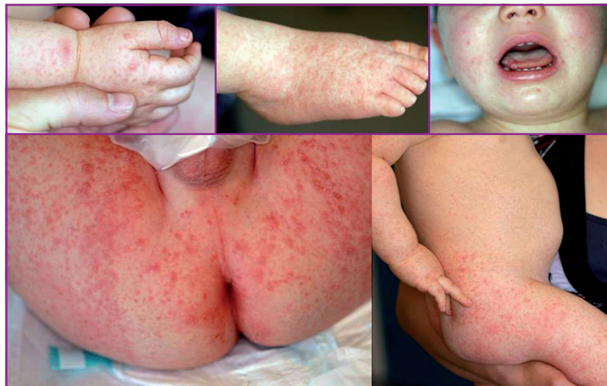
FIG. 2 : Syndrome pieds-mains-bouche généralisé.

Les infections à Staphylococcus aureus et à streptocoque peuvent être associées à des exanthèmes : scarlatine et syndrome de choc toxique pour le streptocoque, scarlatine staphylococcique, syndrome de choc toxique staphylococcique et épidermolyse aigüe staphylococcique (EAS) pour le Staphylococcus aureus . Ces syndromes sont liés à la sécrétion de toxines par ces bactéries à partir d'un foyer infectieux, ORL ou cutané le plus souvent. Le lien entre le type de toxines et les caractéristiques des exanthèmes est bien établi pour le S. aureus . Les toxines superantigènes (entérotoxines et TSST-1) sont responsables du syndrome