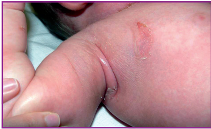
FIG. 4 : Epidermolyse aiguë staphylococcique pauci-symptomatique : décollement prédominant aux plis contemporains de l'exanthème.

de choc toxinique et de la scarlatine staphylococcique. Les exfoliatines A et/ou B sont associées à l'épidermolyse aiguë staphylococcique. L'EAS est décrite comme un exanthème chaud associé à des bulles ou érosions post-bulleuses. Le décollement est généralisé. Cette description correspond aux formes sévères des EAS rencontrées principalement en période périnatale. Il existe une forme moins sévère d'EAS caractérisée par un exanthème et un décollement au niveau des plis. Cette forme d'EAS pauci-symptomatique est volontiers confondue avec une scarlatine staphylococcique.