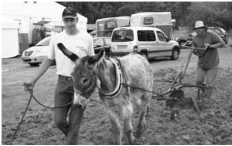
Demonstratiounen vun der Aarbecht mam Iesel an Zesummenaarbecht mat de Vertrieder vu PROMMATA an den Ieselfrënn Lëtzebuerg

Niewent den Ausstellungs- an Informatiounsstänn ass den Intressenten e flotten an ofwieslungsräichen Animatiounsprogramm iwwer déi dräi Deeg vun der FAE ugebueden ginn. Fir d'Opstellung an d'Realisation vun dësem Programm konnte mir op de Knowhow an d'Ënnerstëtzung vun der Agence interculturelle vun der ASTI (Association de Soutien aux Travailleurs Immigrés) zréckgräifen. D'Zelt vum Jubäumsjoer ass äis frëndlecherweis vum Verband Group zur Verfügung gestallt ginn.