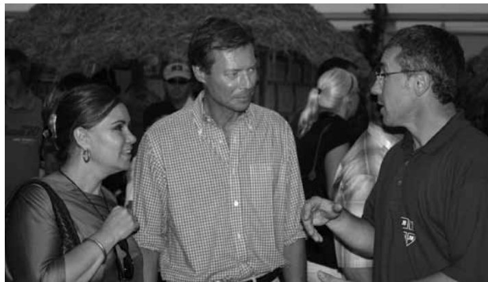
Och déi Groussherzoglech Koppel huet déi laangwierereg Preparatiounsaarbechten mat hierer Präsenz honoréiert a ganz groussen Intressi um Stand vom Jubiläum gewissen