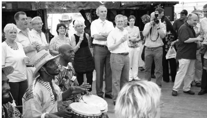
Mat afrikanesche Rhythmen sinn déi Offiziell während der Ouverture vun der FAE am Zelt vom Anniversaire empfaange ginn

Intresséiert en Androck vun den alldeegleche Gegebenheeten am ländlechen Afrika kritt.