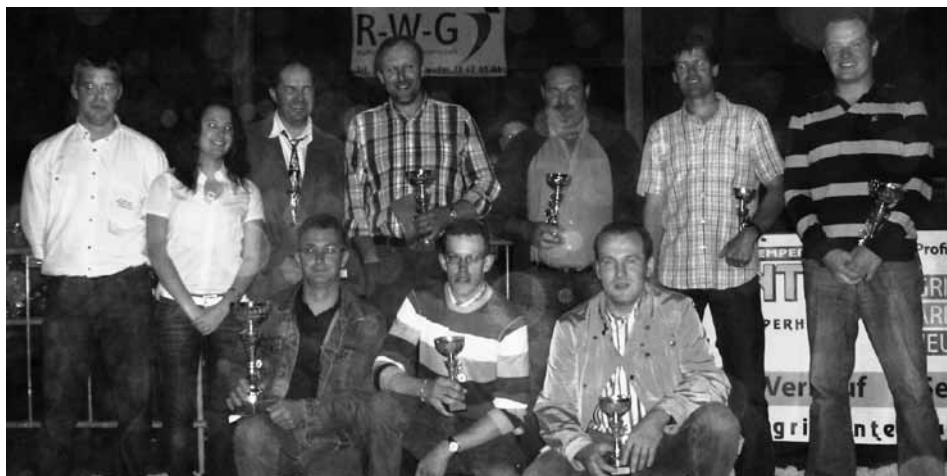
Die stolzen Gewinner der 27. Auflage des CMJ