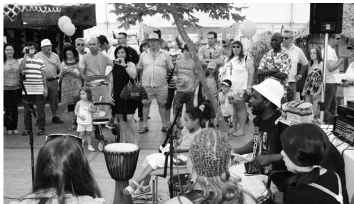
Dee gutt gefüllten Animatiounsprogramm huet ëmmer nees fir grouss Begeeschterung bei de Visiteure gesuert

Vill weider Fotoen vom Jubiläumzelt fënnt deen Intresséierten ënner www.jongbaueren.lu