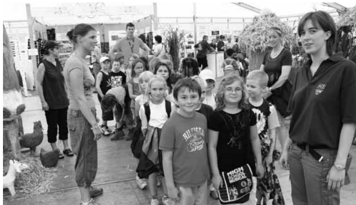
Eist afrikanesch Duerf huet sécherlech zu den Héichpunkte vun den dësjährege Féierungen vun de Schoulkanner gezielt