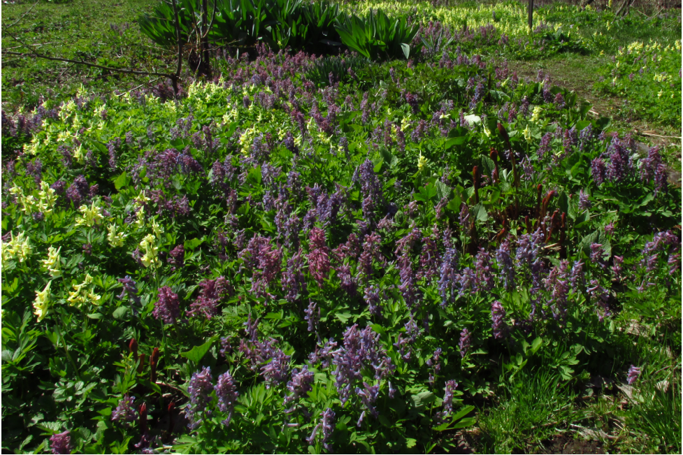
Рис. 9. Поколение сиреневоцветковых хохлаток, выросшее самостоятельно и происходящее от интродуцированных растений

Отдельные растения с узкими листочками – C. begljanovae ; с широкими листочками C. lacrimuli-cuculi ; растения в плотных группах – C. nidus-serpentis .