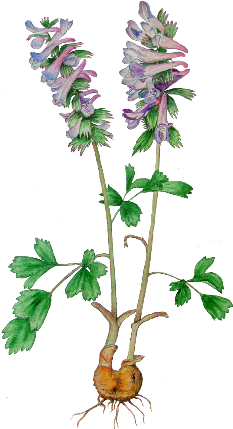
Рис. 2. Corydalis lacrimuli-cuculi Stepanov, sp. nov.