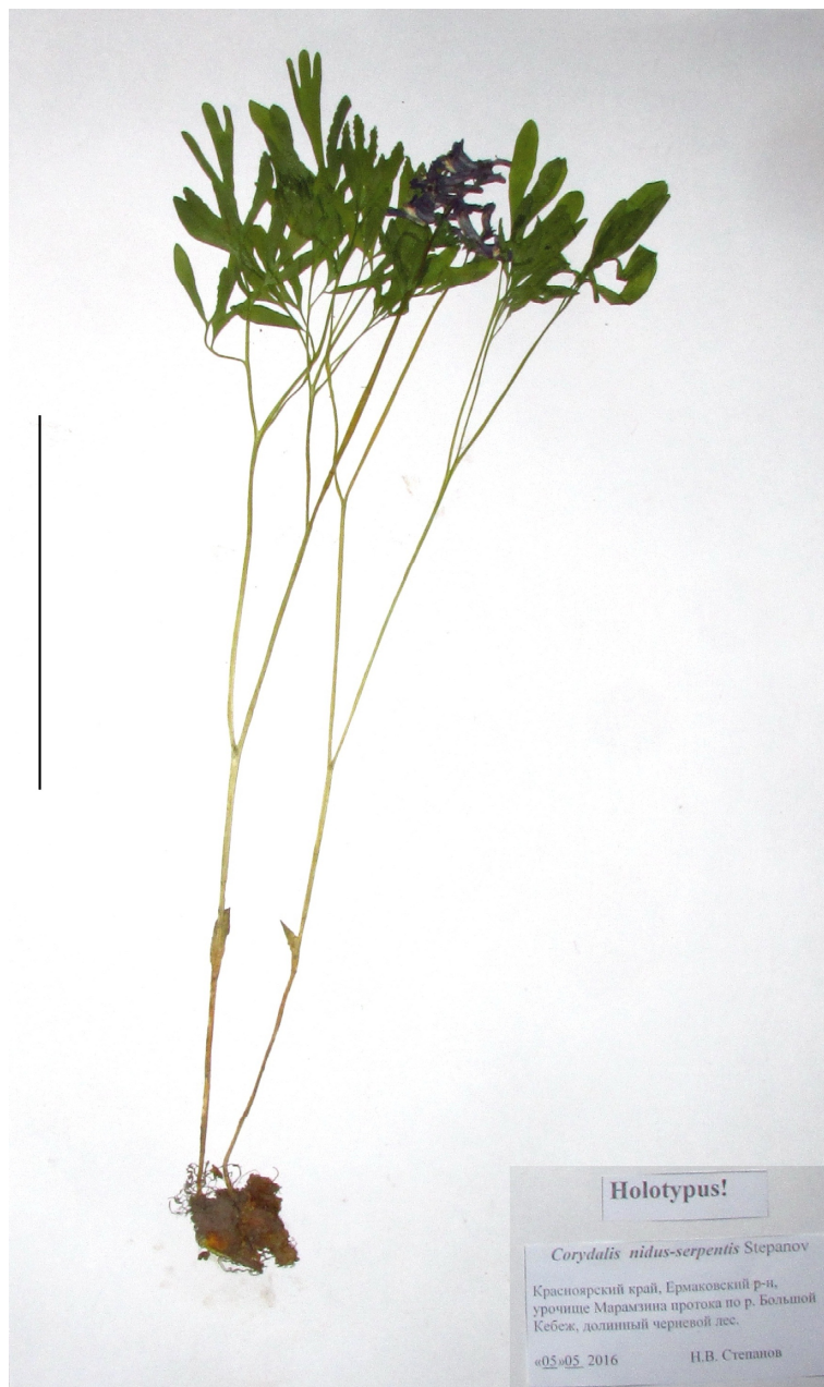
Рис. 7. Голотип Corydalis nidus-serpentis Stepanov, sp. nov. Масштабная линейка 10 см