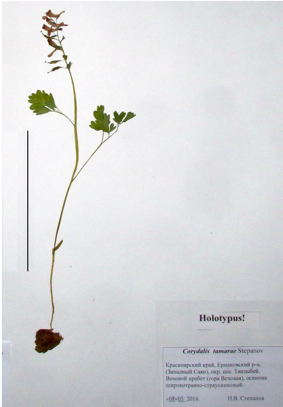
Рис. 3. Голотип Corydalis tamarae Stepanov, sp. nov. Масштабная линейка 10 см