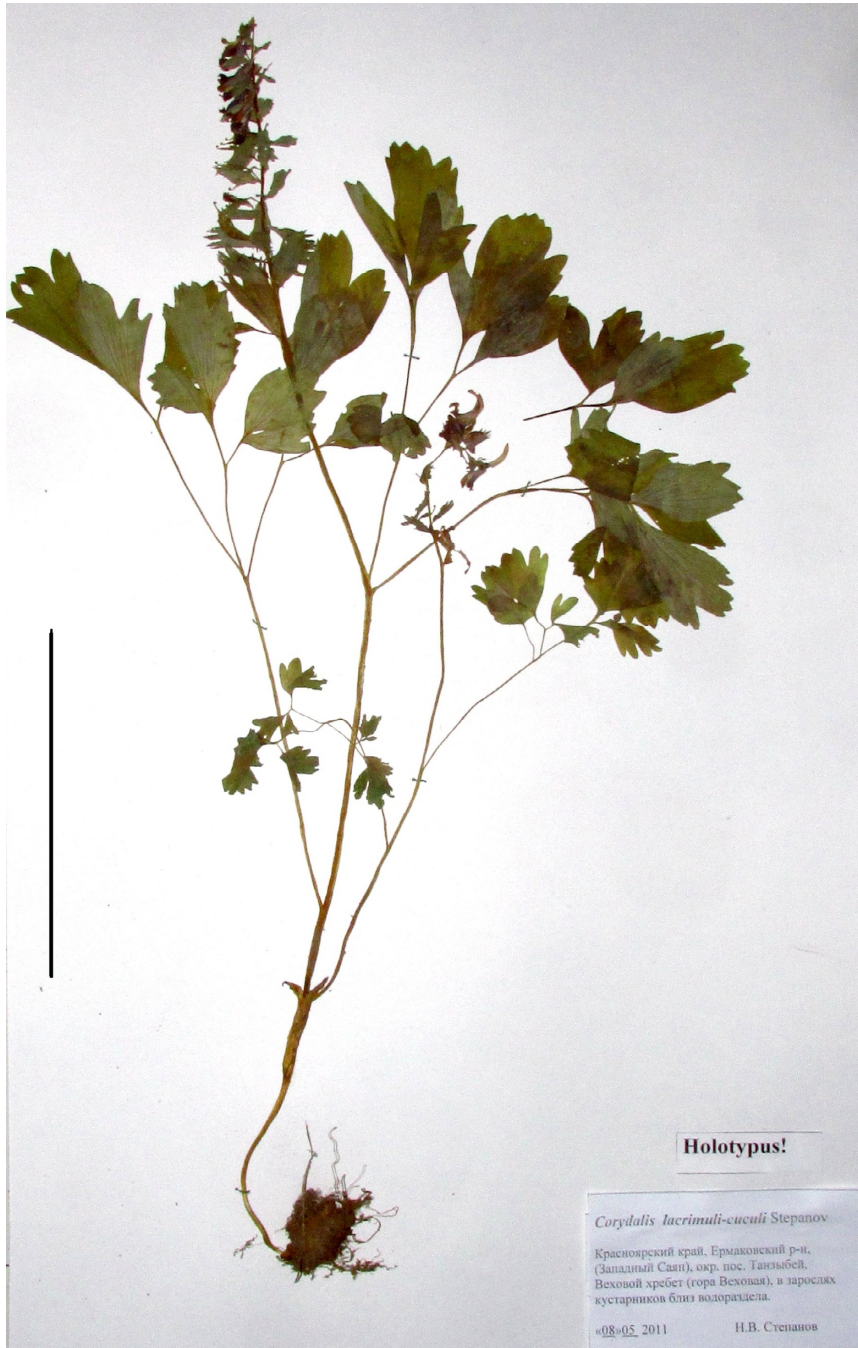
Рис. 1. Голотип Corydalis lacrimuli-cuculi Stepanov, sp. nov. Масштабная линейка 10 см