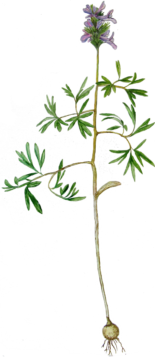
Рис. 6. Corydalis begjanovae Stepanov, sp. nov. Figure 6. Corydalis begjanovae Stepanov, sp. nov.