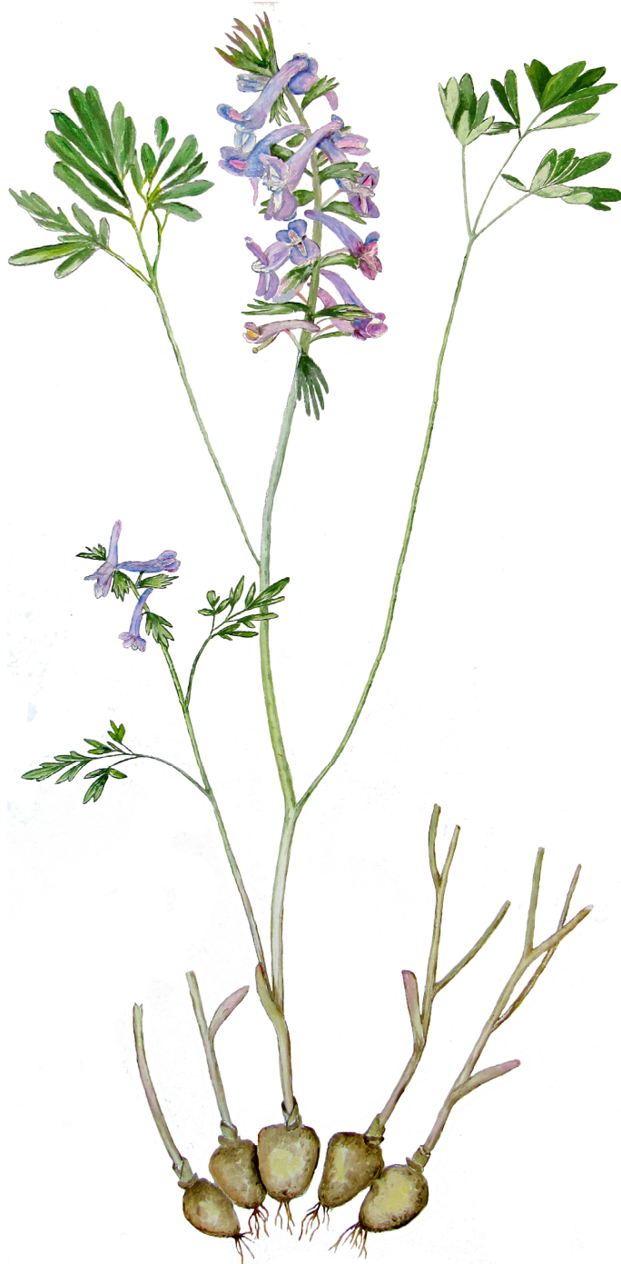
Рис. 8. Голотип Corydalis nidus-serpentis Stepanov, sp. nov. Figure 8. Holotype of Corydalis nidus-serpentis Stepanov, sp. nov.