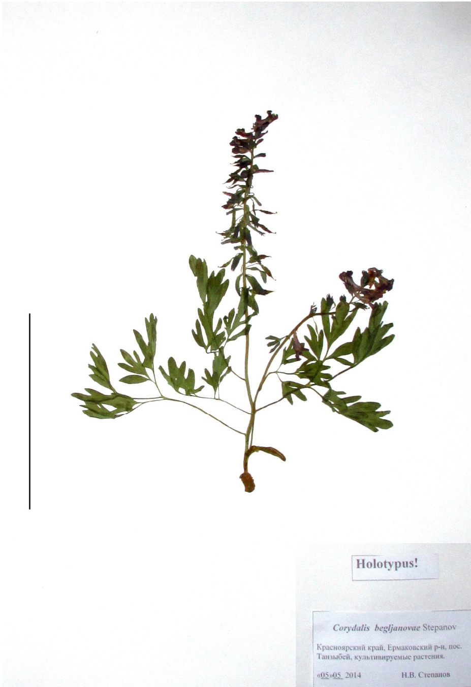
Рис. 5. Голотип Corydalis begjanovae Stepanov, sp. nov. Масштабная линейка 10 см