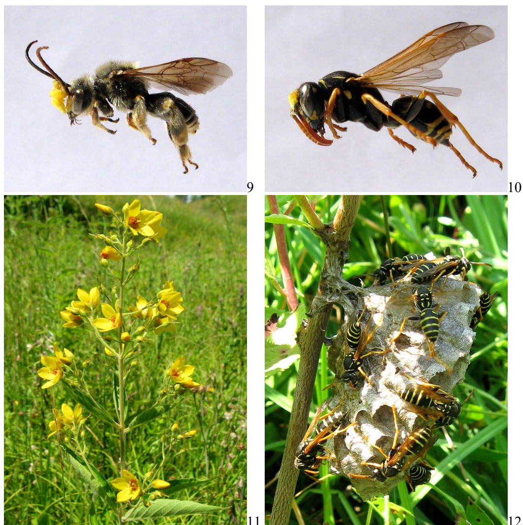
Рис. 9–12. Опылители Epipactis palustris

9 – самец Macropis frivaldskyi с поллиниями орхидеи; 10 – самка Polistes nimpha с остатками поллиния орхидеи; 11 – соцветие Lysimachia vulgaris – кормового растения пчел рода Macropis ; 12 – гнездо Polistes nimpha , построенное на участке произрастания орхидеи.