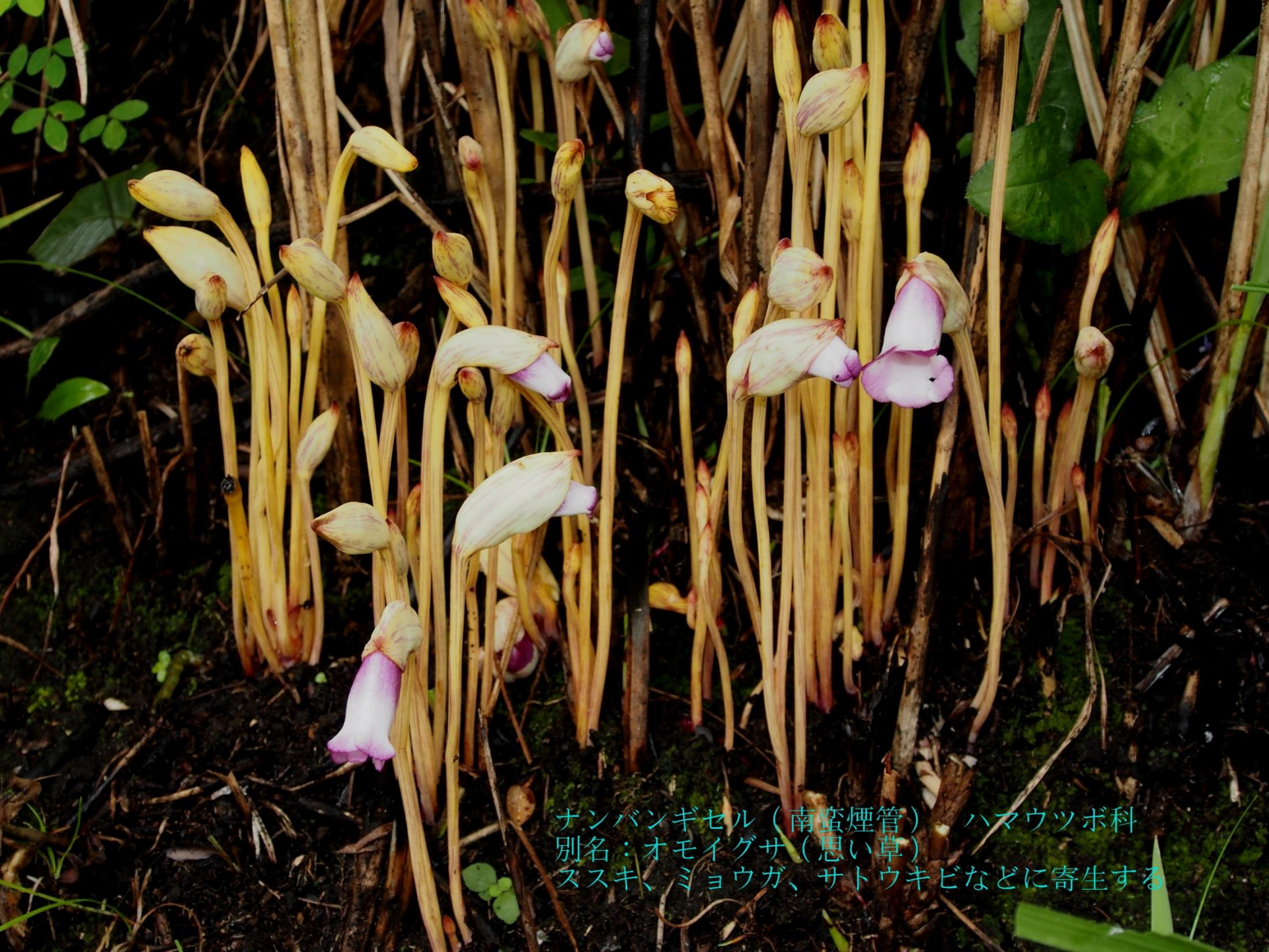
ナンバンギセル（南蛮煙管） ハマウツボ科 別名：オモイグサ（思い草） ススキ、ミョウガ、サトウキビなどに寄生する