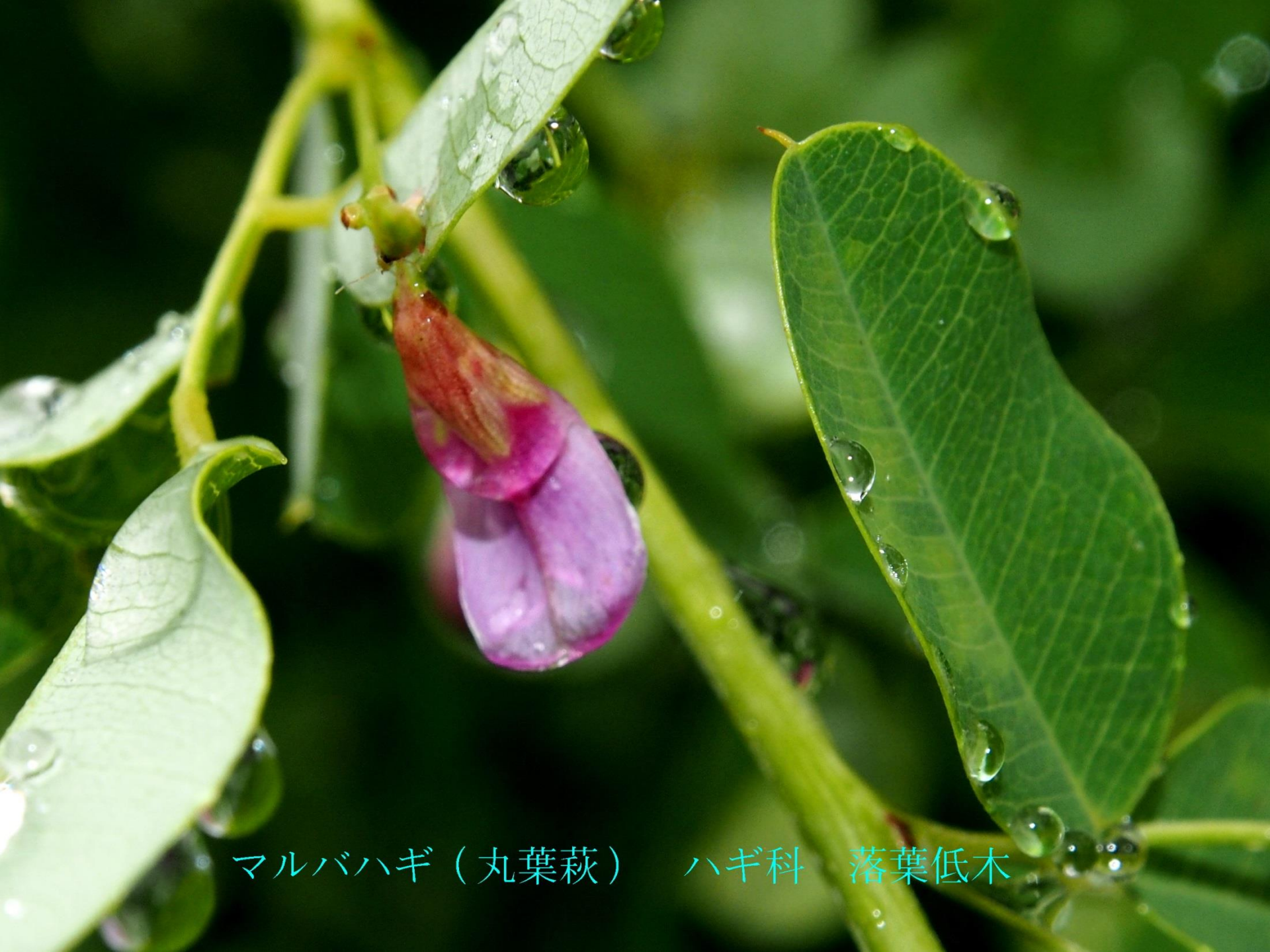
マルバハギ（丸葉萩） ハギ科 落葉低木