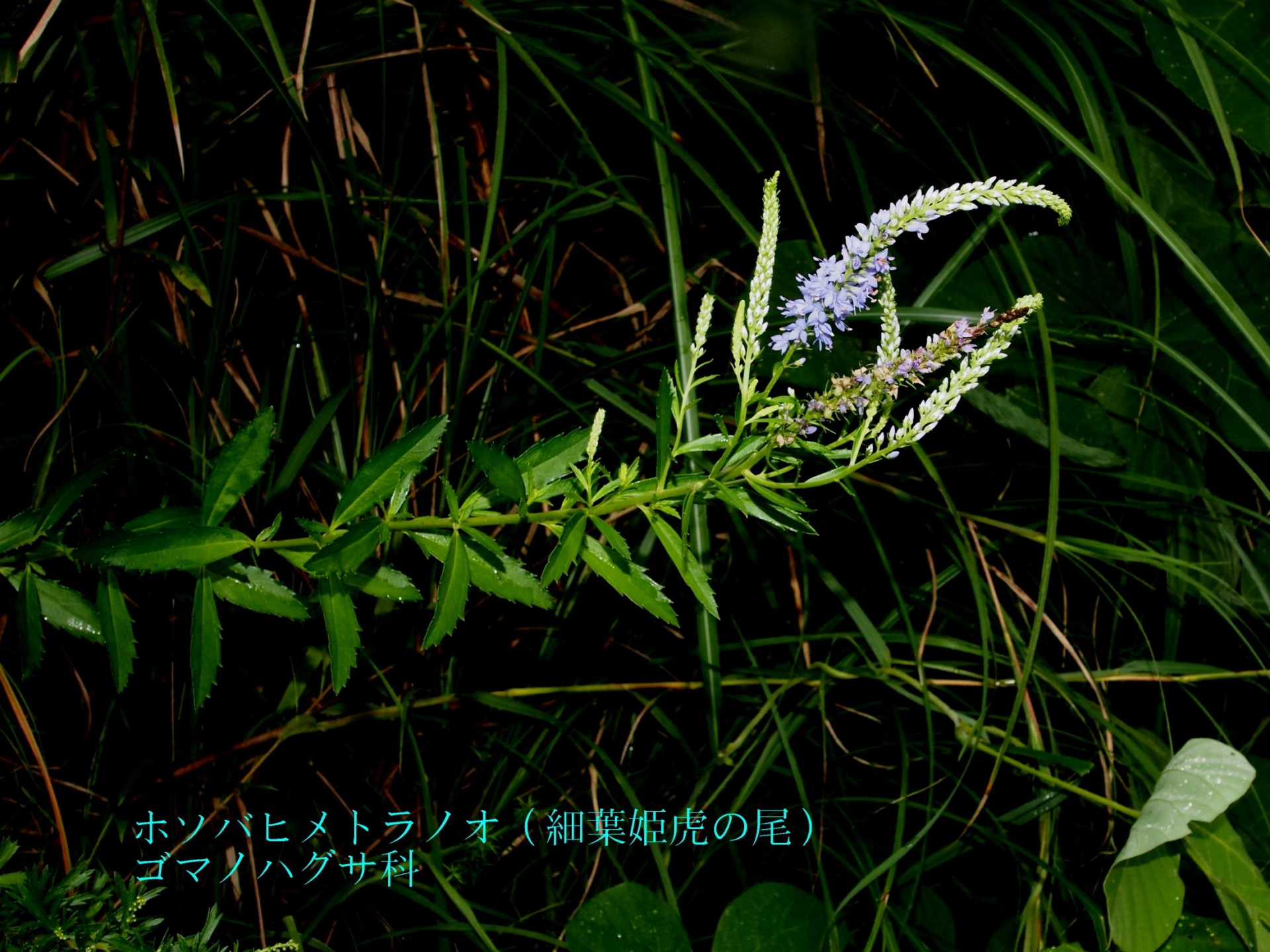
ホソバヒメトラノオ (細葉姫虎の尾) ゴマノハグサ科