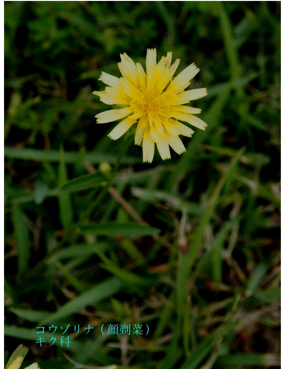
コウゾリナ (顔荊菜) キク科