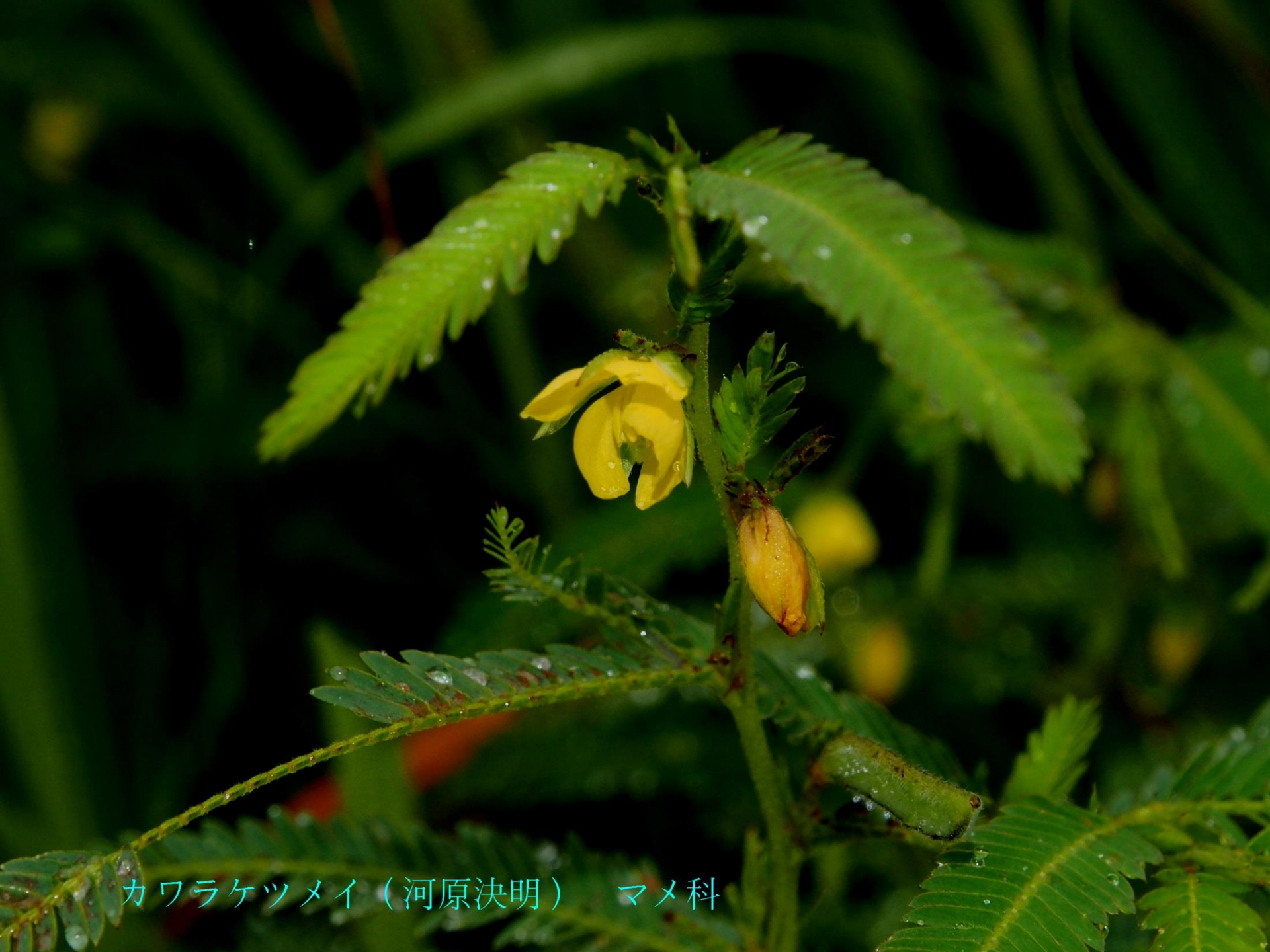
カワラケツメイ（河原決明） マメ科