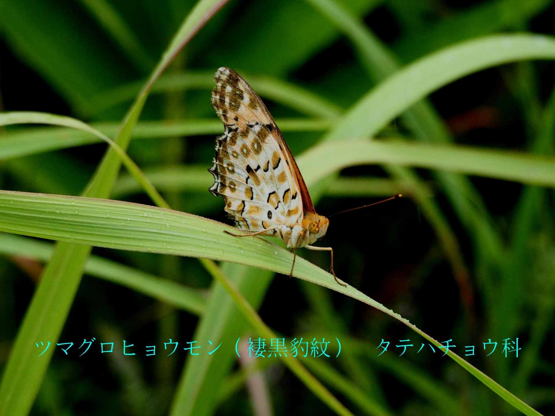
ツマグロヒョウモン（棲黒豹紋） タテハチョウ科