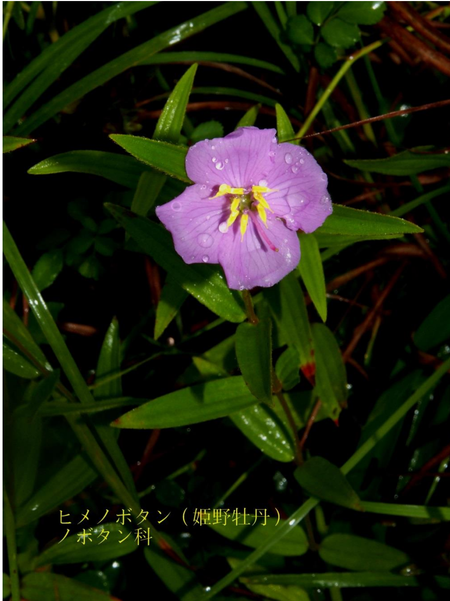
ヒメノボタン(姫野牡丹) ノボタン科