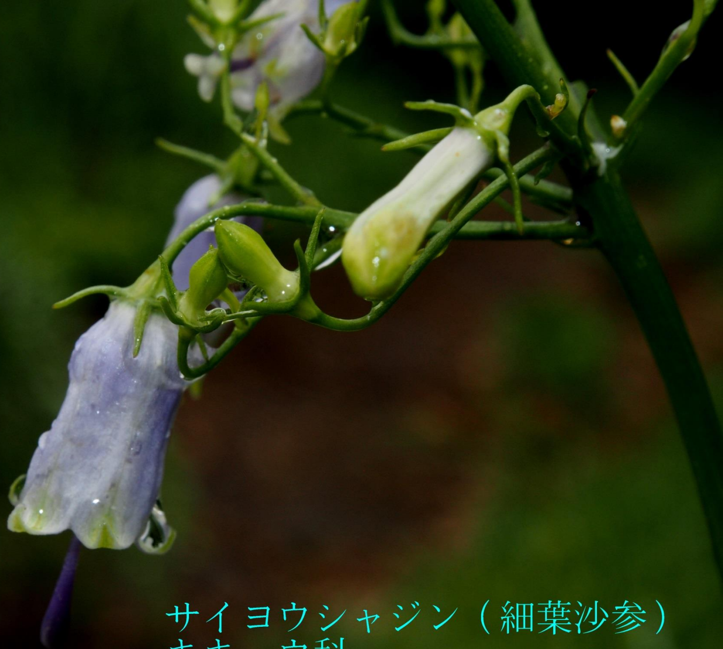
サイヨウシャジン（細葉沙参） キキョウ科