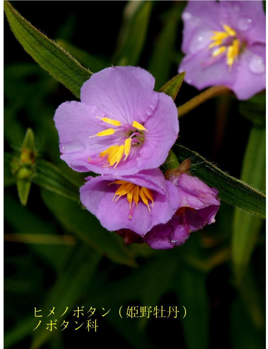
ヒメノボタン(姫野牡丹) ノボタン科