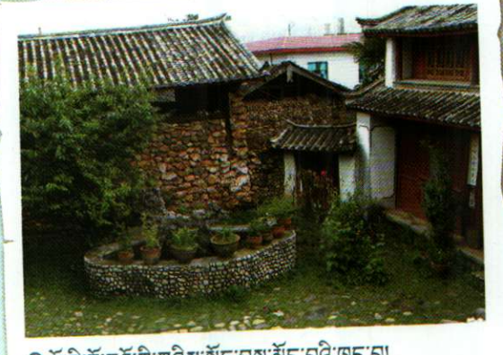
○ ཡོ་སི་རྫོང་རའོ་ཁོ་གཞིས་སྟོན་བྱས་སྐྱོང་བའི་ཁང་།