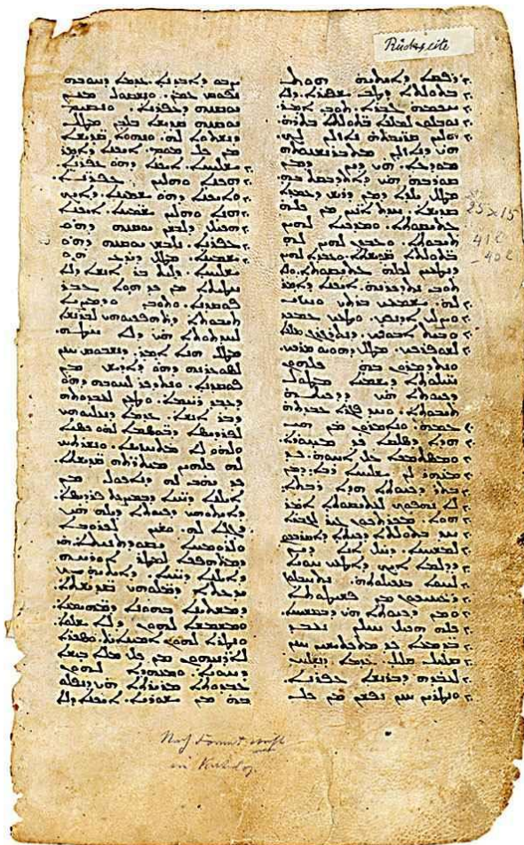
MS 574 Syriac estrangela book script. Mt. Sinai, Egypt, 9th c.

➤ Yo fè konnen ke se Esdras ki reskonsab pou 4 liv sa yo: 1 Istwa, 2 Istwa, Esdras ak Neemi.