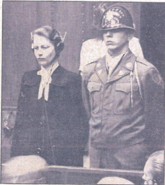
KZ-Ärztin Oberheuser (1947): Nachbehandlung mit Benzin

Der Militärgerichtshof verurteilte die Ärztin Oberheuser, die bei den einzelnen Versuchen jeweils „Haupttäterin oder Mittäterin“ war, zu zwanzig Jahren Haft, die sie freilich nicht abzusitzen brauchte: Sie wurde bereits 1952