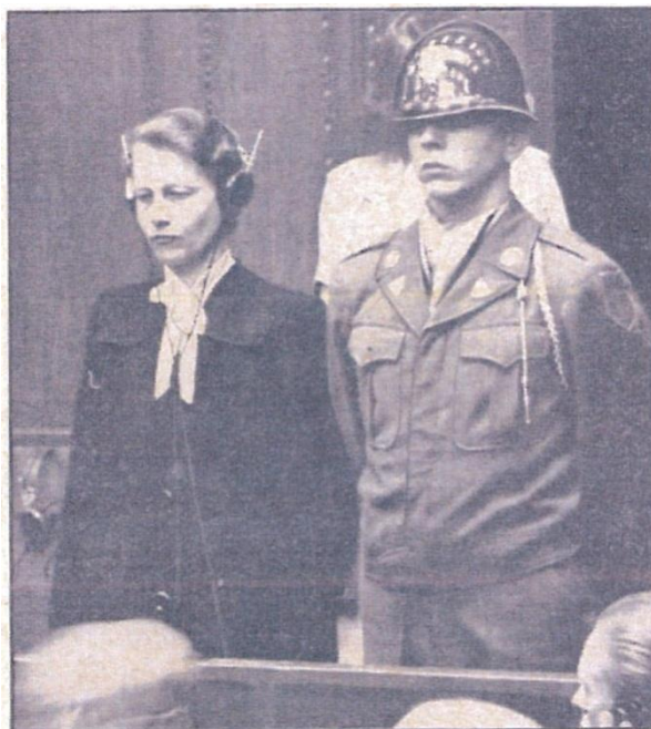
Camp Doctor Oberheuser (1947): Benzene as an after-treatment.

The Military Court sentenced Dr Oberheuser, who acted either as “the main perpetrator or accomplice” in individual experiments, to twenty years’ imprisonment. She did not have to serve this term in full, however. She was released as early as 1952 from Landsberg prison, where Hitler was once also incarcerated.