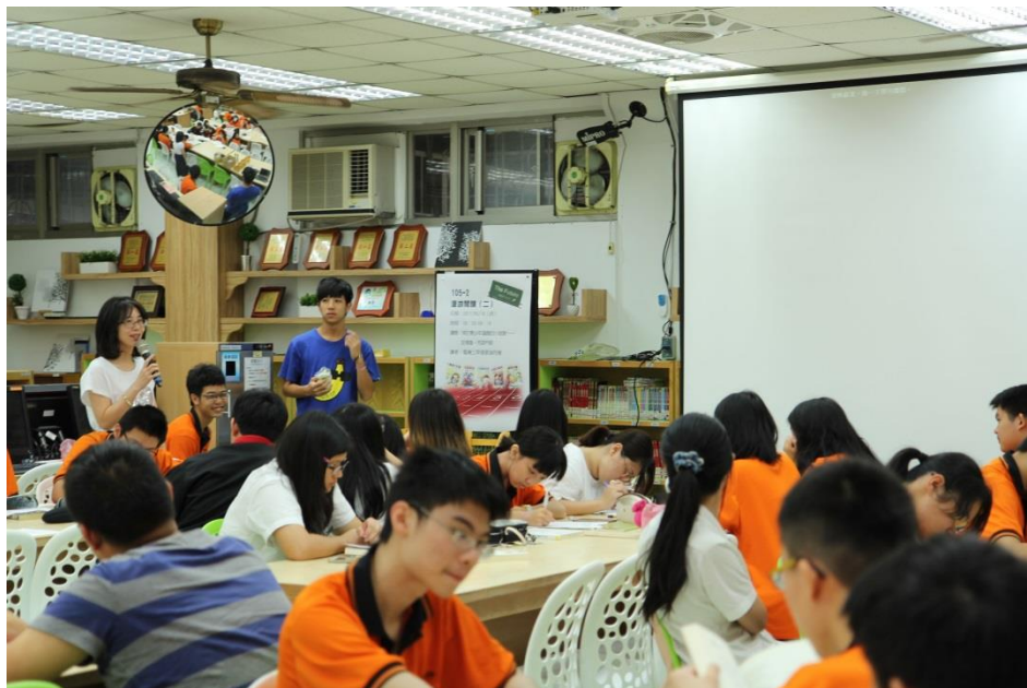
家嵐老師在開場前來向同學們講解流程 (老師，辛苦了～)