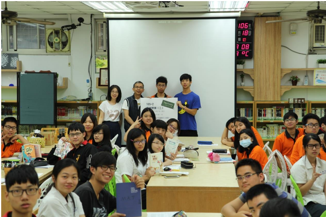
活動的大合照！完美～