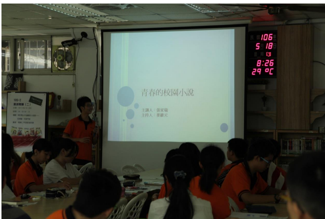
終於開始了！主講人滔滔不絕地在分享 主講人認真地講，同學認真地聽（好和諧喔～～）