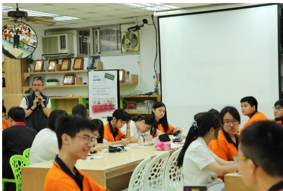
主任也來為主講人做開場白囉！ (謝謝主任)