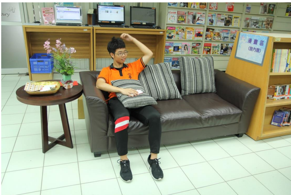
主講人出場前的輕鬆時刻～