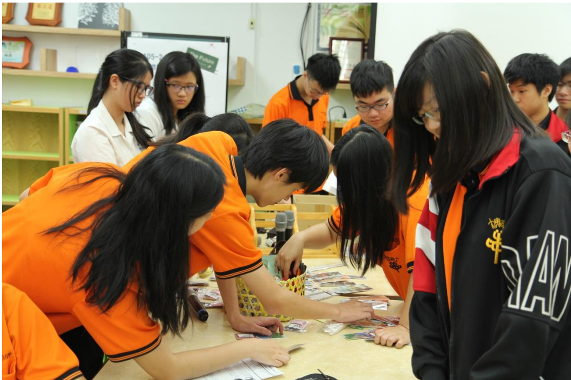
最後的小禮物時間（別搶別搶啦！人人都有份）