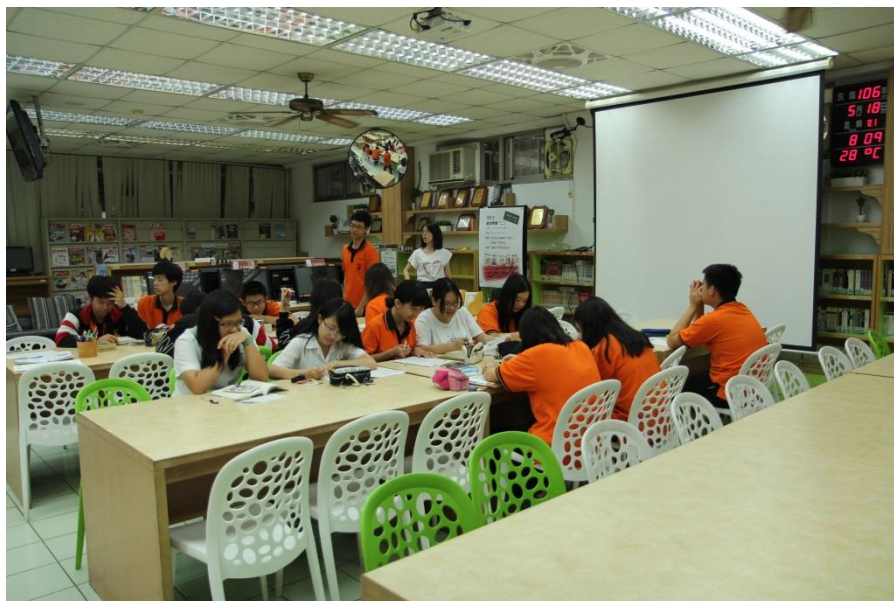
熱情參加的同學們都提前到場 (很給力唷！)