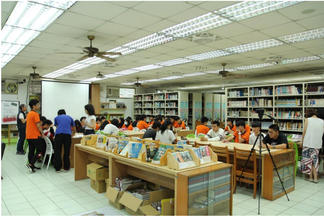
活動結束，主任講話了！