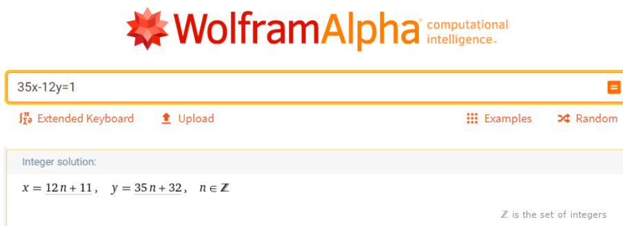
Attēls 2: WolframAlpha atrisinājums vienādojumam.

Sienāzis nevar izmantot lēcieni (x + 35; y + 12) mazāk kā 11 reizes, jo pie k = 1, \dots, 10 , skaitlim 35k nebūs atlikums 1, dalot ar 12. Lai atrastu visus atrisinājumus vienādojumam 35x - 12y = 1 , var izmantot Eiklīda algoritmu (meklēt LKD skaitļiem 35 un 12, lai atrastu veidus, kā izteikt LKD(35, 12) = 1 ). Var arī izmantot WolframAlpha [5] vienādojumu risinātāju; tur ir redzami arī atrisinājumi veselos skaitļos: