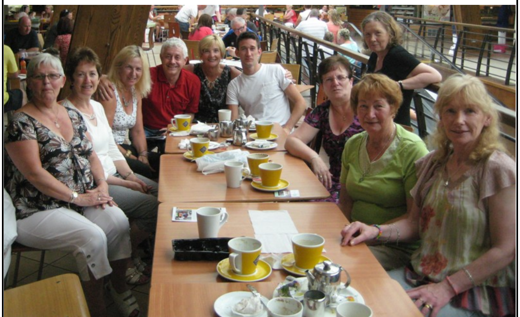
Muintir Fhionnghlaise ar chuairt ar Dhomhnach Míde