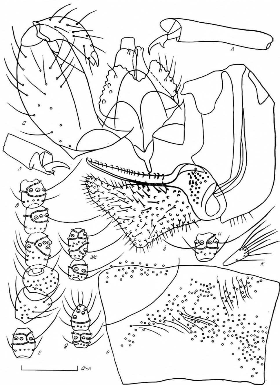
Рис. 1. Детали строения Stefaniola hammudae sp. n.: а—д — самец; е—л — самка; а — гениталии; б. л — коготок лапки; в — скапус, педцелл. 1—3-й членики жгутика; г. и — 5-й членик жгутика; д — 12-й и 13-й членики жгутика; е — дорсальная сторона стерноплевры; ж — 15-й и 16-й членики жгутика; з — яйцеклад; К — щупик (масштаб 0,1 мм).

крупными размерами тела. От S. ustjurtlensis Fedotova из стеблевых галлов на ежовнике шерстистоногом ( Anabasis eriopoda (Schrenk) Benth.) (там же) новый вид отличается более вздутыми боковыми краями гонокситов, расширяющимися к основанию церками, удлиненными, а не поперечными средними члениками жгутиков самца и самки,