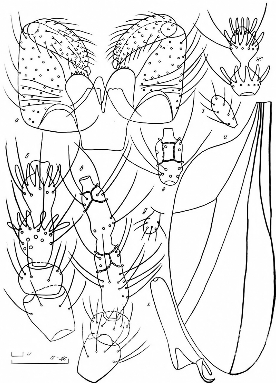
Рис. 3. Детали строения Halodiplosis hammadae sp. n.: а, б, г, д, ж, и — самец; в, е, з — самка; а — гениталии; б — скапус, педицелл, 1-й членик жгутика; в — скапус, педицелл, 1-й и 2-й членики жгутика; г — коготок лапки; д, з — щупик; е — 5-й членик жгутика; ж — 12-й членик жгутика; и — крыло (масштаб 0,1 мм).

Самка. Длина тела 2,2—3,4 мм при нерасправленном яйцекладе. Антенны 2+11, членики жгутика со стебельками, средние с перетяжкой в базальной трети, длина 1-го в 1,3 раза больше длины 2-го, длина 5-го в 2,2 раза больше ширины, базальное утолщение в 3,9 раза больше стебелька. 11-й членик слегка сужается к вершине, в 1,3 раза длиннее 10-го. Щупик овальный, но сильнее расширен в дистальной