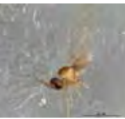
[Lateral] Cecidomyiidae BIN URI: BOLD: AAH2876