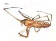
[Dorsal] Tetragnatha versicolor BIN URI: BOLD: ACN2276