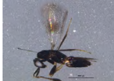
[Lateral] Mymaridae BIN URI: BOLD:ACP8766