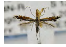
[Dorsal] Phyllocnistis insignis BIN URI: BOLD:AAU3009