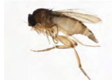
[Dorsal] Phoridae BIN URI: BOLD:AAU6600