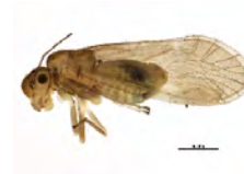
[Lateral] Valenzuela BIN URI: BOLD:AAP2603