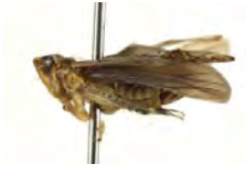
[Lateral] Prescottia lobata BIN URI: BOLD:AAV6739