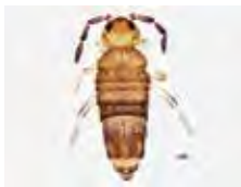
[Dorsal] Lepidocyrtus BIN URI: BOLD: ACM2009