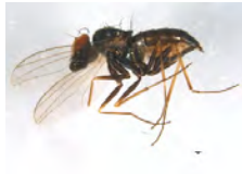
[Lateral] Dolichopodidae BIN URI: BOLD:AAG6929