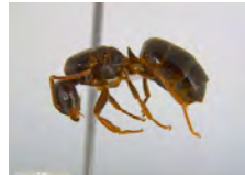
[Lateral] Lasius BIN URI: BOLD:ACE8629