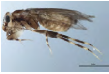
[Lateral] Psocoptera BIN URI: BOLD:AAP4625