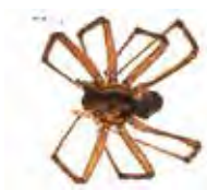
[Dorsal] Agelenopsis potteri BIN URI: BOLD: AAB5726