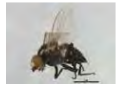
[Lateral] Calycomyza majuscula BIN URI: BOLD: AAV4861