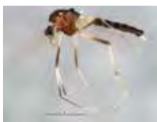
[Lateral] Chironomidae BIN URI: BOLD: AAG1002