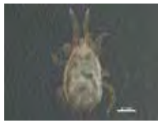
[Dorsal] Mesostigmata BIN URI: BOLD: ACP8596