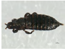
[Dorsal] Phlaeothripidae BIN URI: BOLD:AAG0737