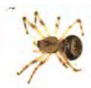
[Dorsal] Drapetisca alteranda BIN URI: BOLD: AAH7066