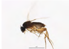
[Lateral] Phoridae BIN URI: BOLD:AAU6529