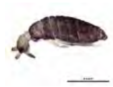
[Lateral] Entomobrya sp. BIN URI: BOLD: AAA7249