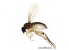
[Lateral] Phoridae BIN URI: BOLD:AAM9349