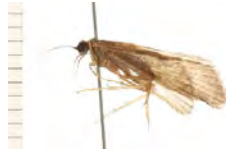
[Lateral] Hydropsyche morosa BIN URI: BOLD:AAA3680