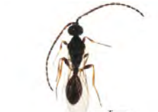
[Dorsal] Belyta validicornis BIN URI: BOLD:AAU8736