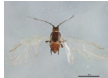
[Dorsal] Myzus cerasi BIN URI: BOLD:AAB2802