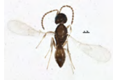
[Dorsal] Telenomus BIN URI: BOLD:ACC8435