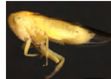
[Lateral] Hemiptera BIN URI: BOLD:AAG8836