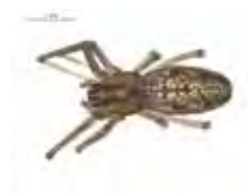
[Dorsal] Tetragnatha versicolor BIN URI: BOLD: AAB7995