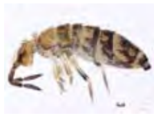
[Lateral] Lepidocyrtus BIN URI: BOLD: ACF1714