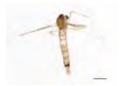
[Dorsal] Chaoboridae BIN URI: BOLD: AAG5462