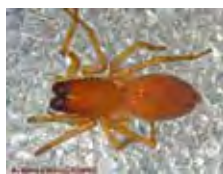
[Dorsal] Clubiona moesta BIN URI: BOLD: AAP3591