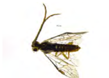
[Lateral] Tenthredinidae BIN URI: BOLD:ACN0565