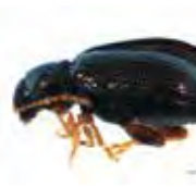
[Lateral] Crepidodera BIN URI: BOLD: AAP7062