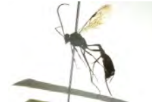
[Lateral] Ichneumonidae BIN URI: BOLD:AAU8848