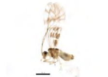
[Lateral] Psocoptera BIN URI: BOLD:ACA2933