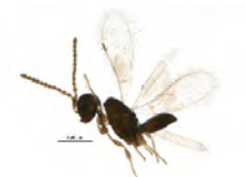
[Lateral] Hymenoptera BIN URI: BOLD:ACI7663