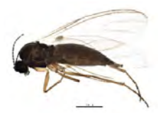
[Lateral] Scatopsiara BIN URI: BOLD:AAH3920