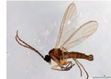
[Lateral] Sciaridae BIN URI: BOLD:AAH3939