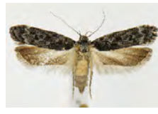
[Dorsal] Anacamptis niveopulvella BIN URI: BOLD:AAC2309