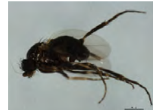
[Lateral] Phoridae BIN URI: BOLD:AAG3236