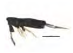
[Lateral] Collembola BIN URI: BOLD: AAB8452