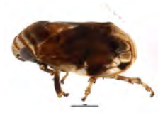
[Lateral] Clastoptera obtusa BIN URI: BOLD:AAG8823