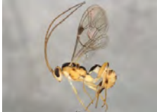
[Lateral] Hymenoptera BIN URI: BOLD:AAA5524