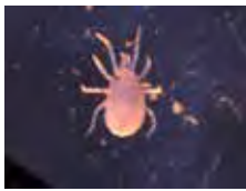
[Ventral] Phytoseiidae BIN URI: BOLD: AAZ6615