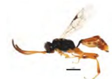
[Lateral] Ichneumonidae BIN URI: BOLD:AAU8234