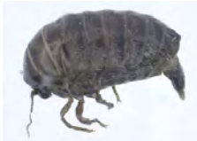
[Lateral] Dahlia triquetrella BIN URI: BOLD:AAD1522