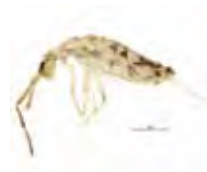
[Lateral] Entomobrya BIN URI: BOLD: ACL6239