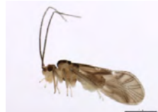
[Lateral] Psocoptera BIN URI: BOLD:AAH3228