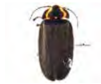
[Dorsal] Elychnia corrusca BIN URI: BOLD: AAF4976