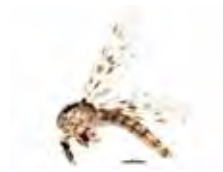
[Lateral] Chaoboridae BIN URI: BOLD: ABV9300