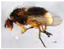
[Lateral] Anthomyiidae BIN URI: BOLD: AAG2461