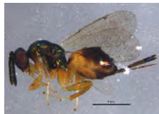
[Lateral] Toryminae BIN URI: BOLD:ACP9608