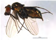
[Lateral] Medetera jacula BIN URI: BOLD:ACE1342