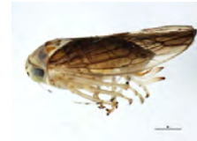
[Lateral] Idiocerus formosus BIN URI: BOLD:AAG2890