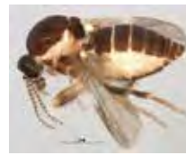
[Lateral] Ceratopogonidae BIN URI: BOLD: AAN5148