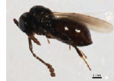
[Lateral] Hymenoptera BIN URI: BOLD:AAU8347