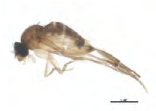
[Lateral] Phoridae BIN URI: BOLD:AAU8534