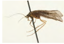
[Lateral] Hydropsyche bronta BIN URI: BOLD:AAA3450