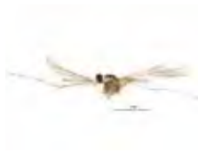
[Lateral] Cecidomyiidae BIN URI: BOLD: ACP8301