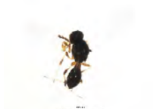
[Dorsal] Hymenoptera BIN URI: BOLD:ABZ8208