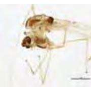
[Lateral] Paratanytarsus dissimilis BIN URI: BOLD: AAE3698