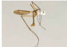
[Lateral] Tipula paludosa BIN URI: BOLD:AAE7386