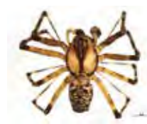
[Dorsal] Pityohyphantes subarcticus BIN URI: BOLD: AAA4185