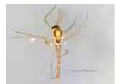
[Dorsal] Chironomidae BIN URI: BOLD: AAN5348