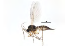
[Lateral] Sciaridae BIN URI: BOLD:AAV1366