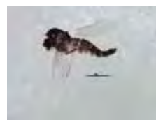
[Lateral] Chironomidae BIN URI: BOLD: AAG5542