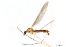
[Lateral] Tipulidae BIN URI: BOLD:AAU6544