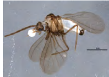
[Lateral] Coniopteryx BIN URI: BOLD:ACI3644