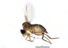
[Lateral] Phoridae BIN URI: BOLD:AAM7996