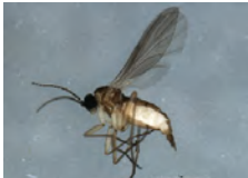
[Lateral] Ctenosciara hyalipennis BIN URI: BOLD:AAH3983