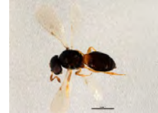
[Lateral] Scelioninae BIN URI: BOLD:ABA6154