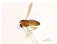
[Lateral] Chironomidae BIN URI: BOLD: ABU5525