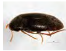
[Dorsal] Orchesia cultriformis BIN URI: BOLD: AAP7011