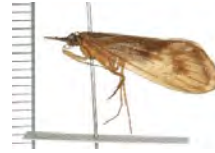
[Lateral] Pycnopsyche guttifera BIN URI: BOLD:AAB0591