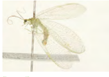
[Lateral] Meleoma signoretti BIN URI: BOLD:AAG2022