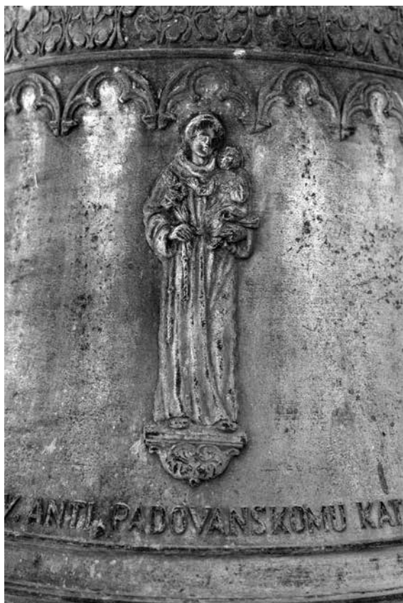
3. Velikom čudotvorcu sv. Anti padovanskom katolici mostarske župe – 460 kg