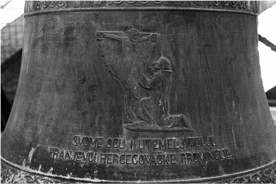
1. Svome Ocu i Utemeljitelju franjevci Hercegovačke provincije – 1700 kg