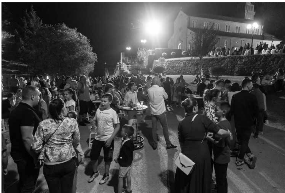
Središnja drinovačka baština – župna crkva, zajedno s brojnim pukom svjedoči predstavljanju monografije