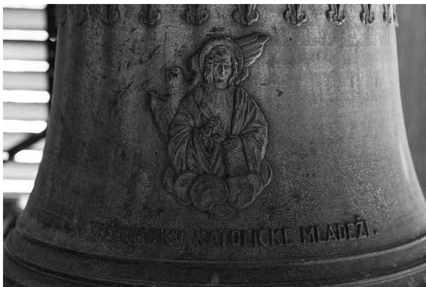
4. Zaštitniku katoličke mladeži sv. Ivanu – 330 kg