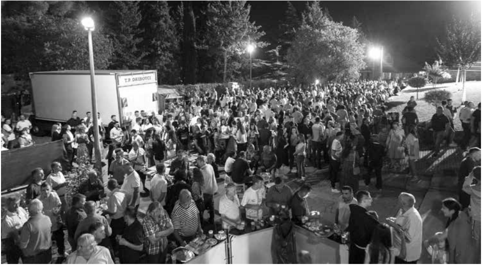
Brojni Drinovčani i gosti uživaju u jedinstvenoj kulturnoj manifestaciji predstavljanja monografije