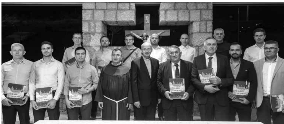
Autori članaka u monografiji, te glavni urednici i ostali članovi uredništva monografije

Drugo poglavlje nosi naslov ŽUPA DRINOVCICI OD OSNUTKA DO DANAS, a sadržava članke: