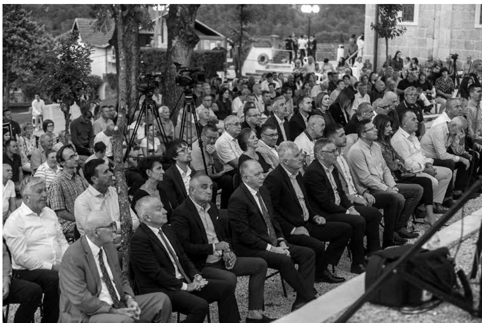
Uglednici i uzvanici pomno prate predstavljanje monografije

Treće poglavlje nosi naslov DRINOVC I U SVJETOVNIM DJELATNOSTIMA, a sadržava članke: