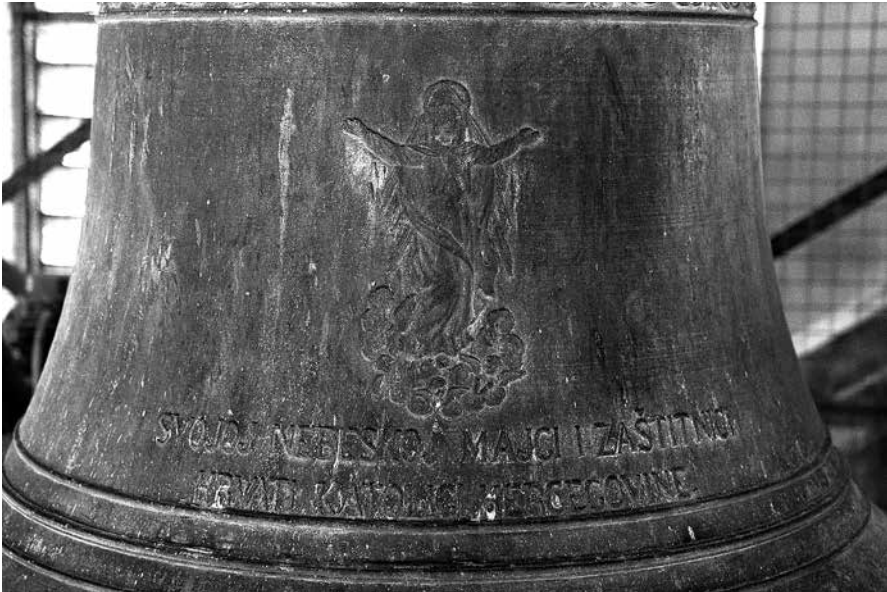
2. Svojoj nebeskoj Majci i Zaštitnici Hrvati katolici Hercegovine – 775 kg