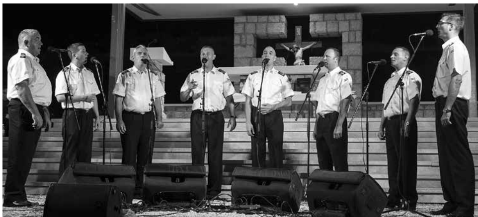
Klapa HRM-a Sv. Juraj uveličala je predstavljanje monografije

stotine i stotine sati uloženi u pisanje monografije, a u njoj ste samostalno napisali dva velika članka i u suautorstvu još 6, pregledavali ste, doradivali i uređivali sve članke, i sve to potpuno volonterski iz čiste ljubavi prema svojim Drinovcima i Drinovčanima, dajem Vam riječ.“