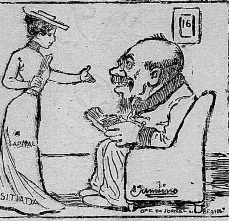
CANSADA DE ESPERAR — Enão, doutor, esqueceu-se de sua candonga!