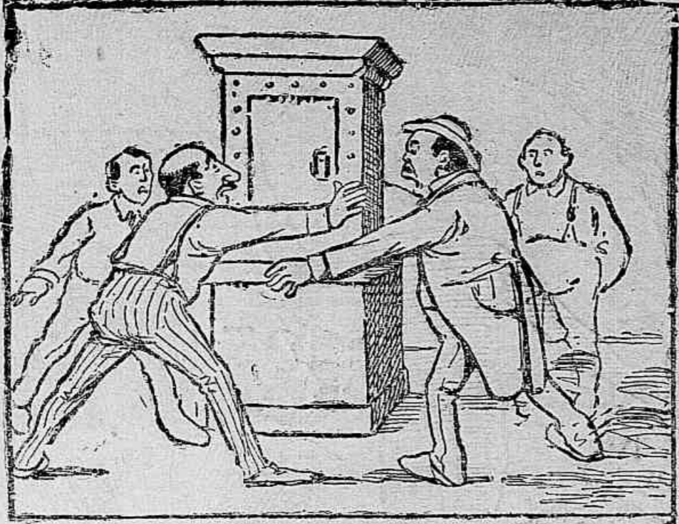
A TRANSAÇÃO DOS 70 CONTOS — Olá, meu caro! Que transação é esta? Vendi-lhe a casa com o cofre, mas o miolo... «nunçaras»!