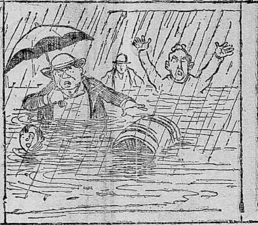
O AGUACEIRO — Era tanta gente a bufar de calor, tanta manguagem contra Phebo, que a Natureza disse: Esperem ali. E prodigamente nos refrescou, despejando agua na quinta-feira, que não foi graga.