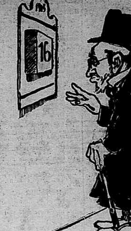
Que decepção! Aquelle lá ficou para o mez que vem. Que pena...