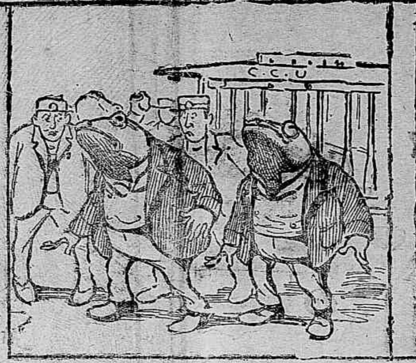
OS «SAPOS» — Cumulo das falsificações: falsificação dos «sapos». Desta vez, porém, quem foi do embrulho não foi o teatro publico, mas os condutores da Carris Urbanos.