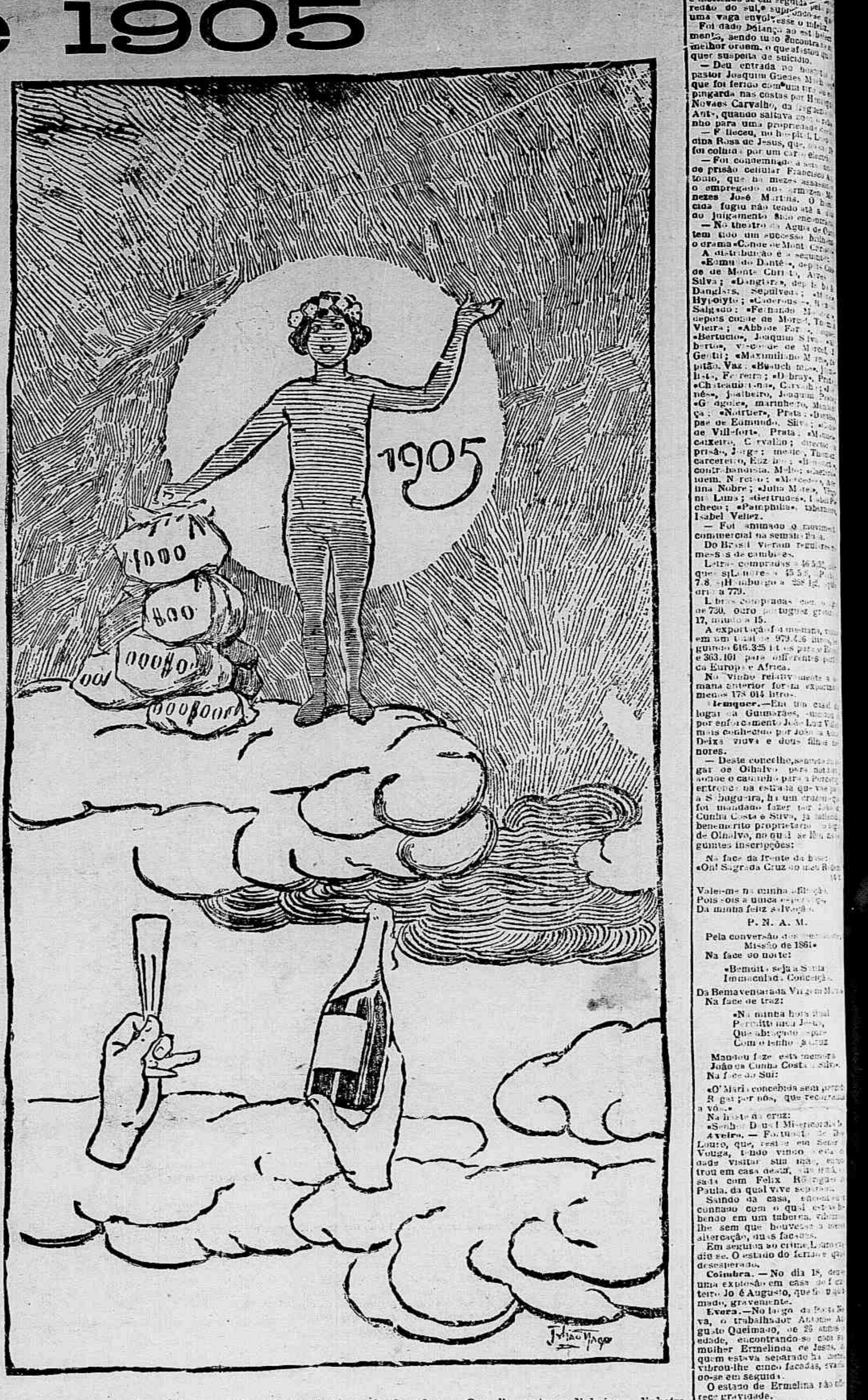
Que 1905 venha para todos vós disposto a realizar o sonho de cada um. Que elle vos traga dinheiro, — dinheiro, muito dinheiro, isto é: a força de fazer o bem e de não fazer o mal, a possibilidade de ser generoso, que é, afinal, em que se resume a felicidade humana.