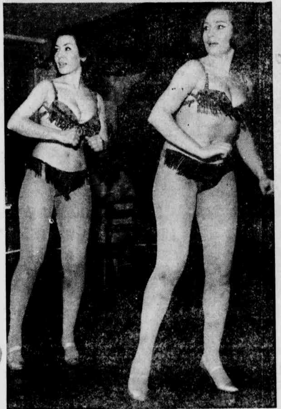
Uma dupla de talento

"É este mesmo" — disse um deles e o assassino não esperou confirmação: enterrou três vezes a peixeira no peito da vítima — Chamado à porta de sua casa veio confiante pensando ser um amigo — Criminoso fugiu com a aproximação de vizinhos e subiu o Morro do Tufui. — (LEIA NA SEGUNDA PÁGINA)