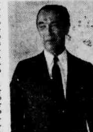
Depois de paraninfar numerosas turmas de formandos em cidades brasileiras, o ex-presidente Juscelino Kubitschek embarcará em janeiro para os Estados Unidos, a convite de universidades, nas quais fará conferências sobre temas de nosso País.

O sr. Juscelino Kubitschek, sempre mantendo sua natural cordialidade, furtou-se a responder a uma série de perguntas dos jornalistas, sempre que se tratava de assuntos políticos.