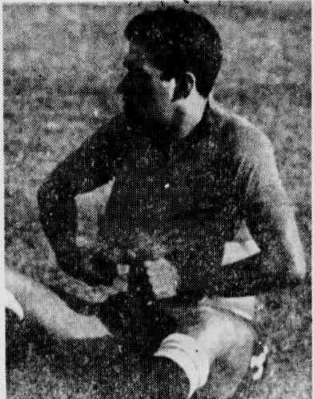
Mané Garrincha, que foi convidado pelos dirigentes do Atlético Mineiro para integrar o time que enfrentará os iugoslavos.

RODADA 22 OUT 68 — A última rodada, a de encerramento do V Campeonato de veteranos, poderá ser realizada dia 22 ou 29, dependendo da conclusão das negociações disputantes. O ex. representante deverá se comprometer com a direção geral de certa forma a fim de ser marcada a data exata para os seus jogos.