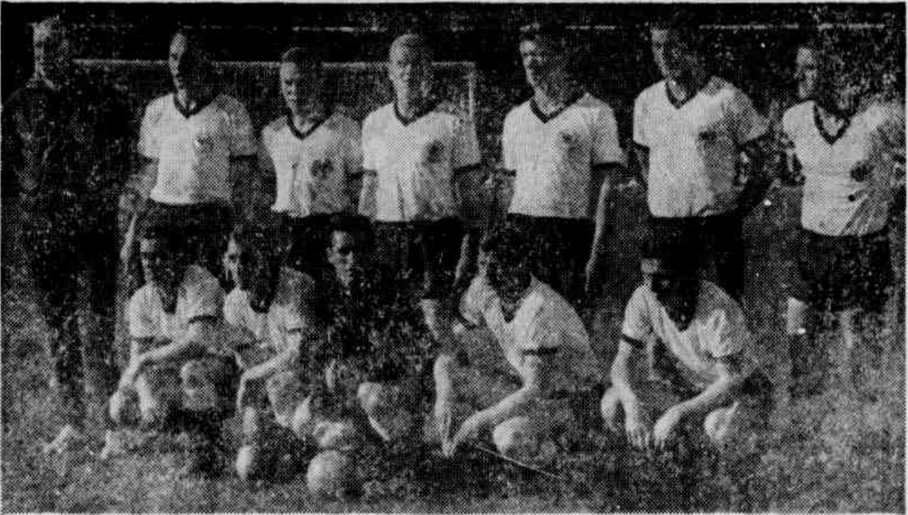
Seleção da Alemanha que jogou no Brasil, ainda sem ter, em sua estrutura, alguns dos grandes jogadores que hoje integram.

feram por causa do cancelamento do terceiro jogo. Zagalo liberou os jogadores logo após o desembarque com ordem de se apresentarem amanhã, à tarde, em General Severiano.