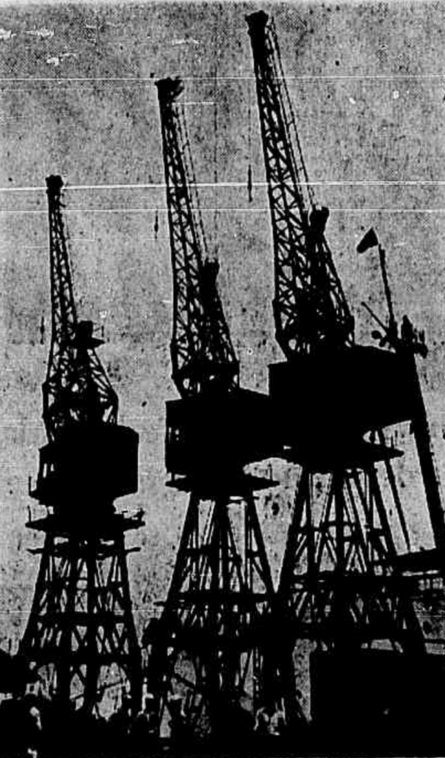
GUINDASTES INERTES — Portuários cruzaram os braços