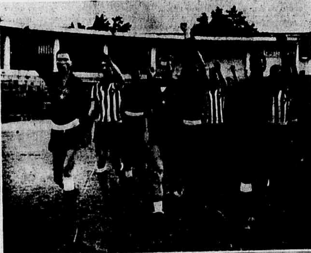
GOLEIROS COMANDAM Depois da goleada em Londrina, quinta-feira última, que serviu, aliás, como bom treino para hoje...