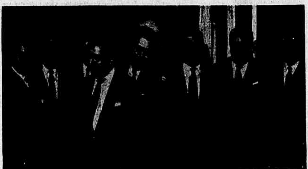
GOVERNADORES REUNIDOS Dizem: Goulart com parlamentarismo

SAO PAULO, 1 (Sucursal) — Foi comunicado distribuído à imprensa, o Conselho Superior do Centro do Professorado Paulista reafirma seu "repúdio a qualquer tentativa de fraude à vontade popular e desrespeito à Constituição". Informa, ainda, que empresta seu integral apoio à Frente da Legalidade Democrática e já deu seus par-