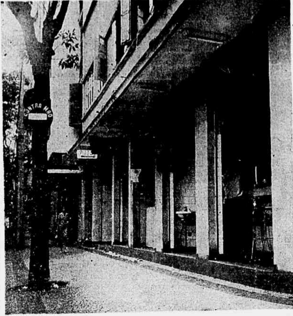
RESTAURANTES Auscência de fiscalização