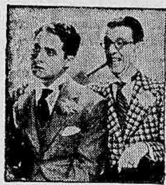
Bert e Robert, no film "Especialistas em Divorcios"

Esta historia, movimentadissima e electrizante, põe em fôco a dupla da gargalhada espontanea, Bert & Robert, o par que fabrica bom humor de graça e que nos Estados Unidos não ha quem não admire.