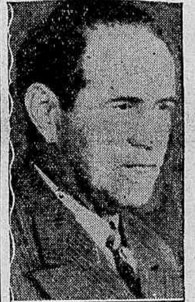
Sr. Oswaldo Aranha

Nada mais deploravel num regime de opinião do que assistir factos, como o denunciado ao chefe do governo, reveladores de que em nosso paiz a circulação e a liberdade de imprensa estão na directa dependencia de empresas detentoras de concessões de serviços publicos, as quaes, pela natureza desses serviços, deviam estar sob a directa vigilancia