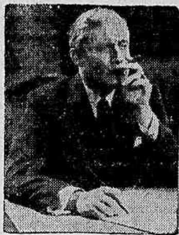
SPENCER TRACY que tem em "Gloria e Poder" uma actuação de apurados plausos

Muito poucas vezes terá o publico do Rio de Janeiro o prazer de assistir a um film cinematographico onde esteja conjugado tantos valores. Seja pela sua "narrativa" perfeita, seja pela direcção impeccavel, seja pela verdade immensa, ou ainda mesmo pela interpretação soberba, o facto é que — "Gloria e Poder" — é bem a obra prima de Jesse L. Lasky para a Fox Film.