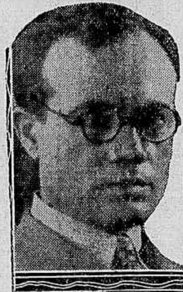
Sr. José Americo