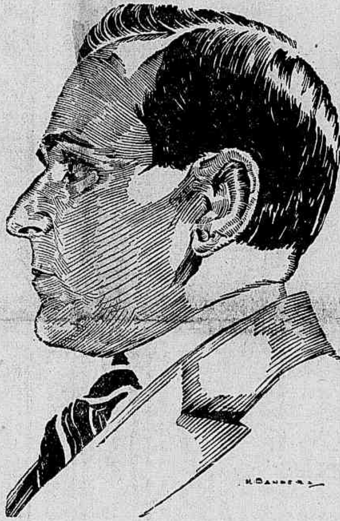
Sr. Getulio Vargas