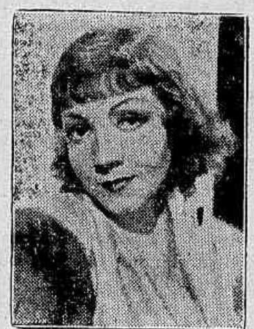
Claudette Colbert, a estrela de "Vozes do Coração", que o Gloria vai exhibir quarta-feira

Claudette Colbert disse ha tempo que estava cansada de representar papéis de anjo da guarda e de freira leiga, que não lhe permitiam vibrar através toda a gamma do seu temperamento.