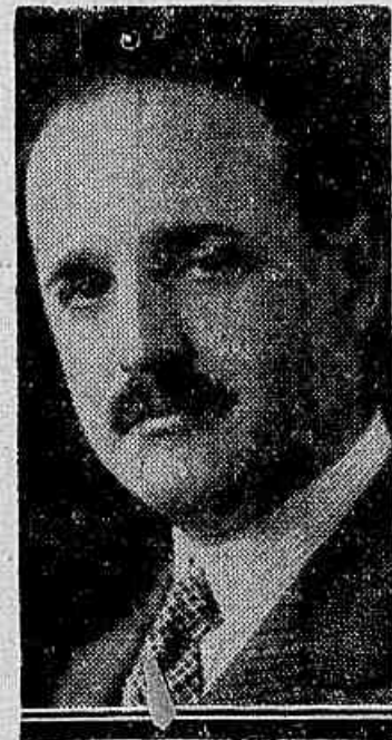
Ministro Salgado Filho

Que fez então? Nada mais, nada menos que