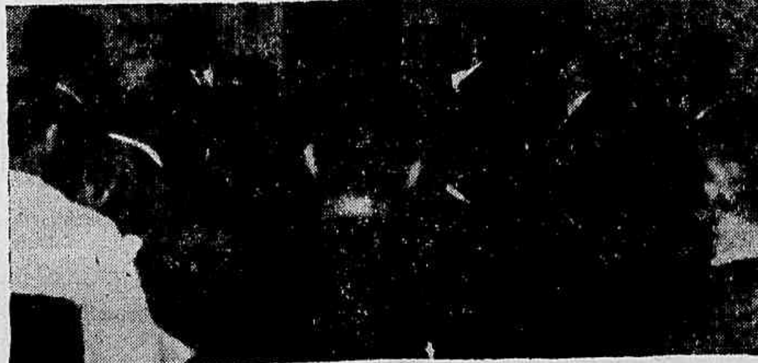
Flagrante tomado no gabinete do ministro da Educação durante a visita