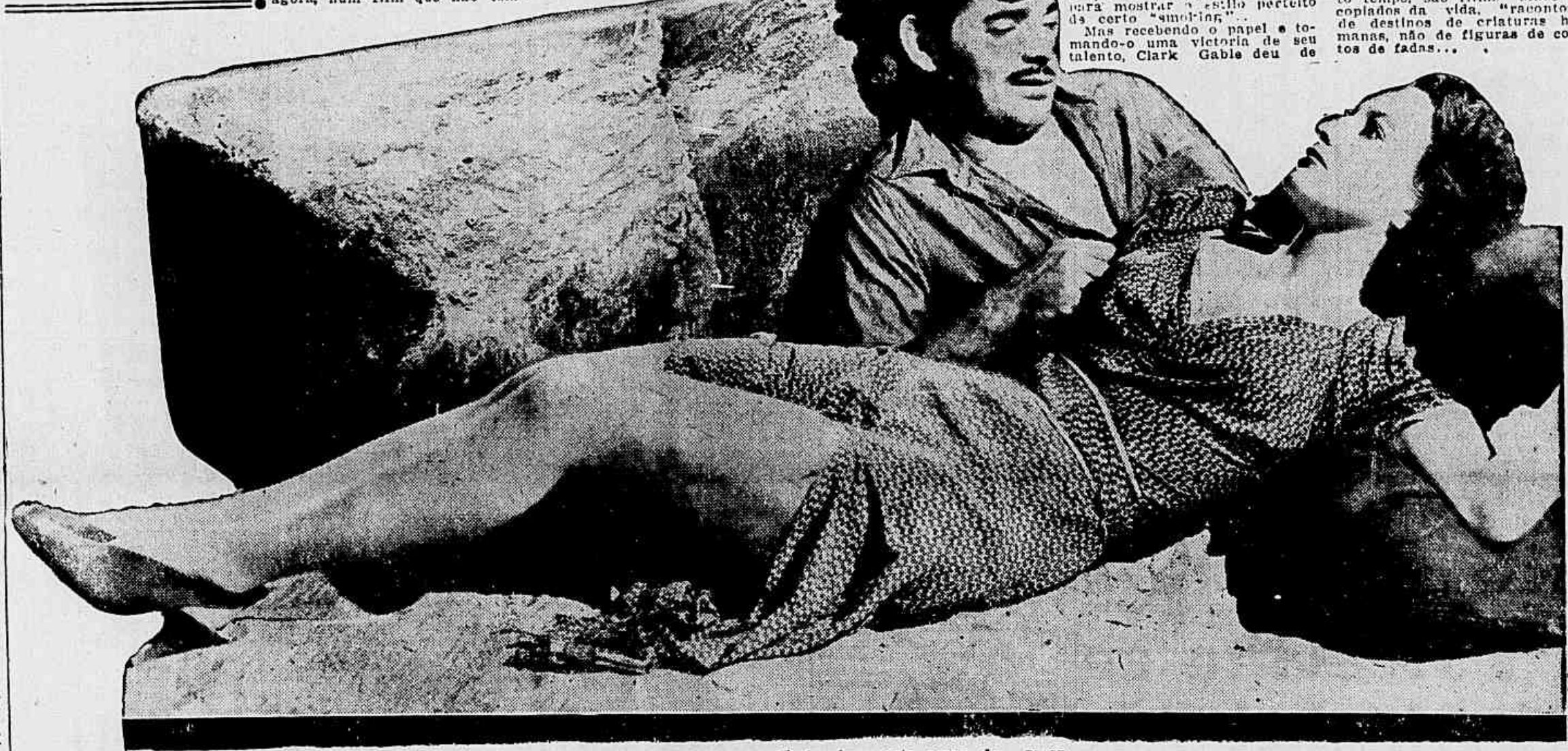
Em "Almas Rebeldes" Joan e Clark vivem esta scena de amor