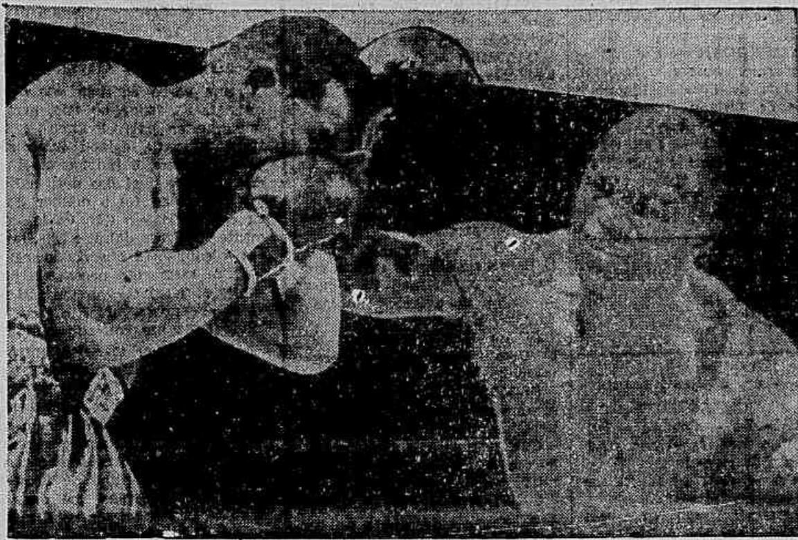
Aspecto do encontro Joe x Walcott, em 1917

Apartir de nossa reportagem ter sido ventilada na Diretoria do sistema gremial, atribuiu a possibilidade da filiação do clube, muito breve, às hostes da Federação Metropolitana de Atletismo.