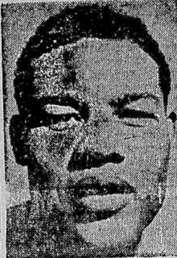
Joe Louis, que se retira invicto

SEXTO ROUND Round favorável a Walcott que ataca mais procurando a todo momento o rosto de Louis. Depois de violento ataque ao campeão a seu corpo, Walcott volta-se de costas para Louis e imediatamente despacha uma esquerda forte entrando com