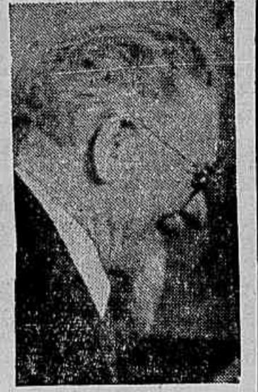
Kainimil, o presidente da URSS, há pouco falecido que fazia discursos para auditórios cuja meta era constatar a existência de agentes da N. K. V. D.

Este o conteúdo do capítulo de amanhã das "Memórias de Ex-Espião de Stalin" cuja publicação jornalística o DIARIO CARIOCA adquiriu com exclusividade e prioridade em todo o mundo. Capítulo que se intitula: