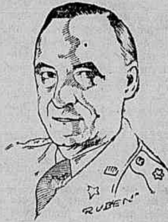
General Lucius D. Clay

Um boato não confirmado diz que o ministro do Exterior soviético, Molotov, se encontra em viagem por via aérea para Berlim sendo portador de planos secretos para a formação de um governo oriental alemão.