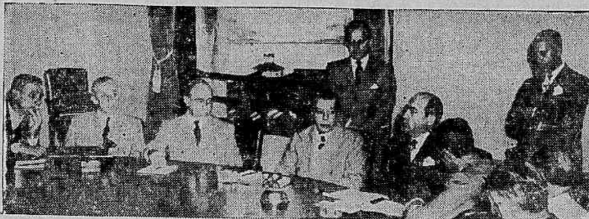
Os representantes madeireiros de Paraná, acompanhados do governador Moisés Lupion, tratam, com o ministro Correia e Castro, dos problemas da classe

PROVIDÊNCIAS Declarou o ministro do Trabalho e o Ministério da Fazenda e o Conselho Federal de Comércio Exterior já estão adotando providências para evitar uma crise de efeitos da indústria extrativa de madeira.