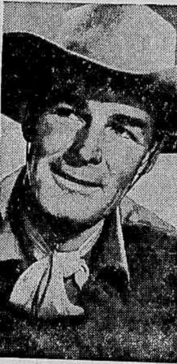
O veterano Randolph Scott, vivendo a impressionante figura de Braxos Kane, no "Terra de Paixões"