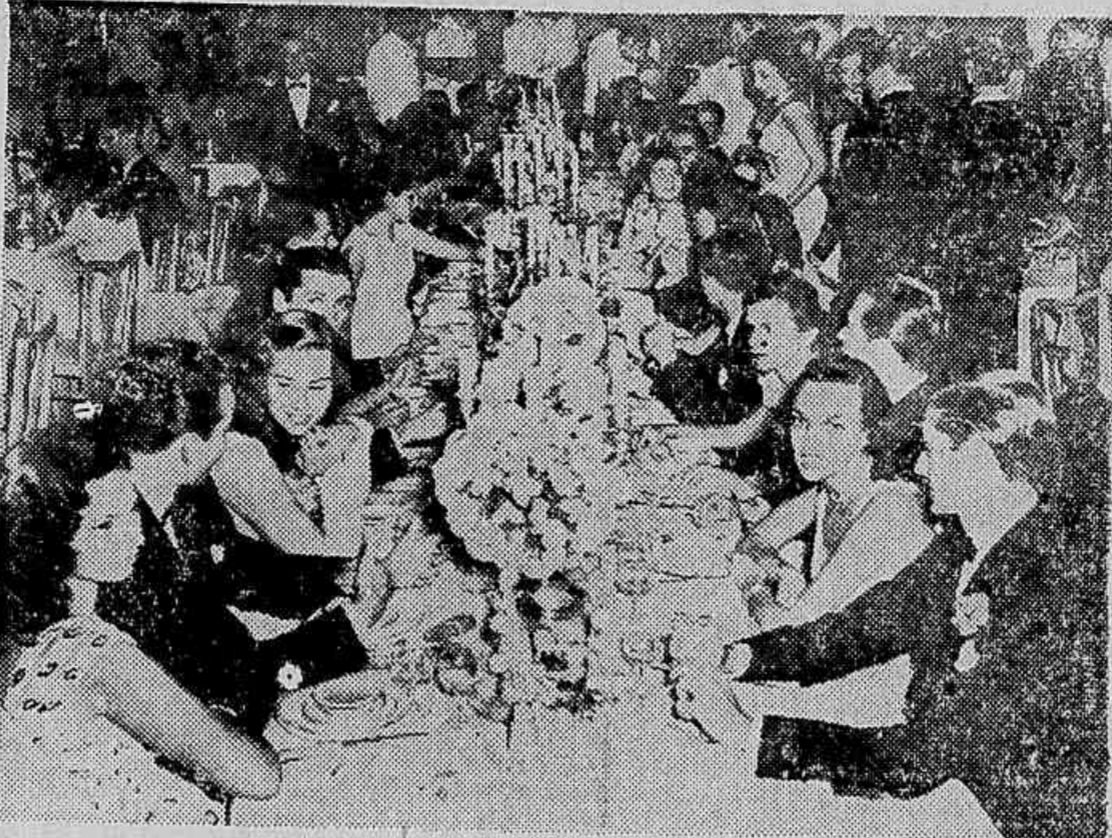
A mesa das Debutantes, no Copacabana