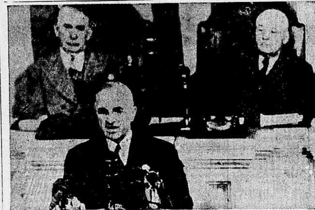
WASHINGTON — Lendo a sua mensagem perante a 81.ª sessão conjunta do Congresso norte-americano, o presidente Truman pede um "moderado", porém não especificado, aumento de impostos. Sentados, vêem-se o vice-presidente Alben Barkley (esquerda) e o líder da maioria Sam Rayburn. (Foto UP-ACME — D. C. — Via aérea).