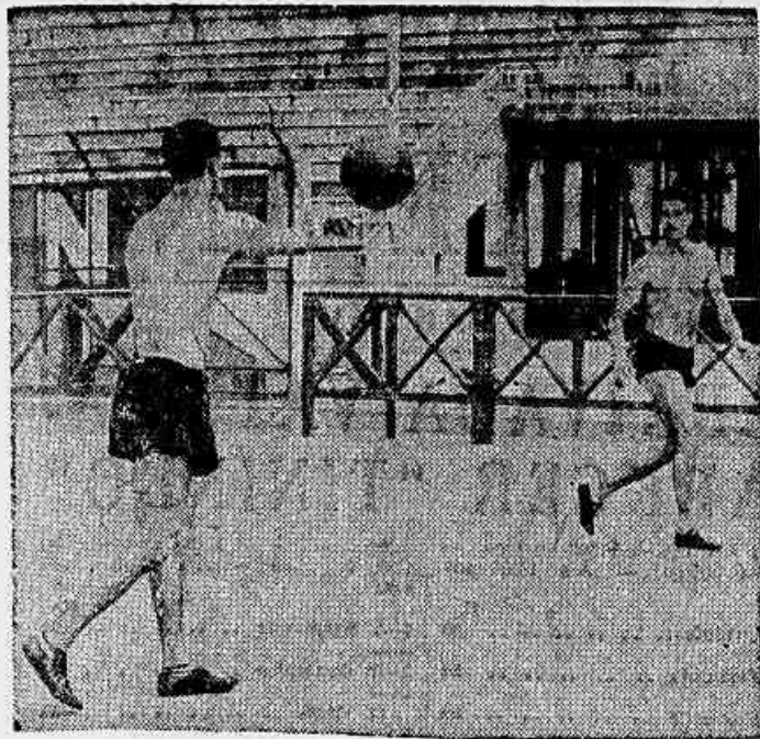
Bate-bola, corrida e um pouco de basket, foi o ensaio de ontem dos brasileiros