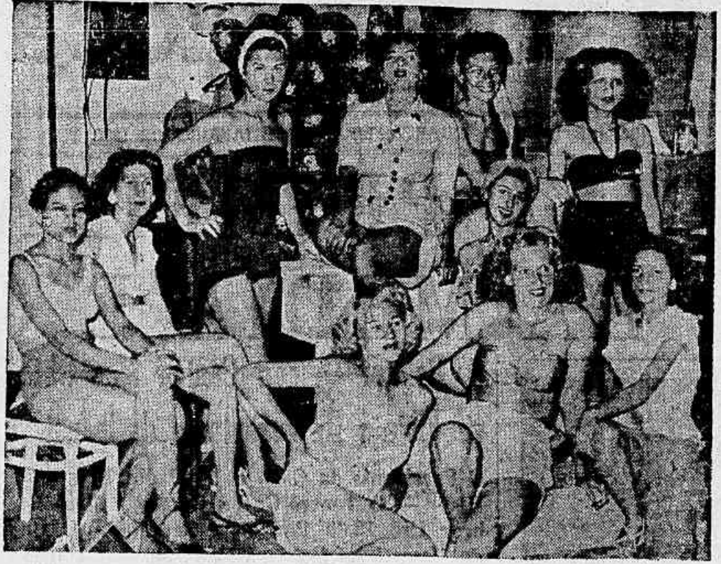
CHEGOU O GENERAL DA BANDA: - Este é o título de uma revista com por cento carnavalesca que será estrelada esta semana no Gloria - Na foto acima vemos um grupo de coristas, durante um intervalo dos ensaios.

GENEROES O movimento verificado foi o seguinte: