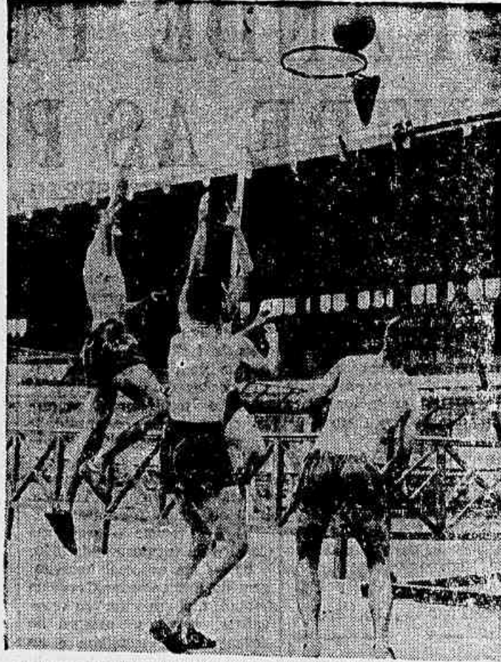
At vemos Danilo e Noronha treinando um pouco de basket na tarde de ontem.