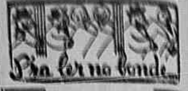
Pa let na bonda