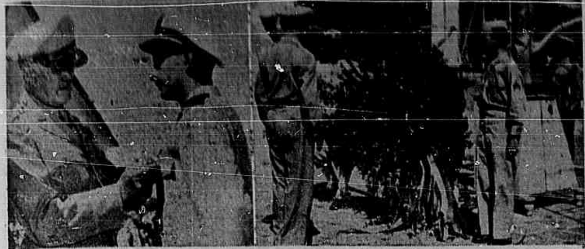
Aspectos da cerimonia de condecoração dos oficiais da Aeronáutica e das homenagens postumas aos pilotos da Força Aérea Brasileira