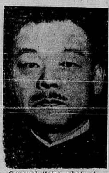
General Koiso, chefe do governo japonês

LONDRES, 10 (U. P.) — A nova investida das forças soviéticas no Extremo Oriente, na região do rio Amur, foi levada a efeito duzentas e noventa milhas ao norte do grande centro industrial de Harbin, por meio de cinco colunas atacantes, pertencentes ao Exército Vermelho do Extremo Oriente. Os contingentes soviéticos avançam ao longo dos rios e das linhas férreas, internando-se pelo Mandchukuo. Duas outras colunas soviéticas atacaram do oeste, enquanto mais duas colunas investiam contra as posições inimigas, pelo leste. Além disso, o comunicado soviético informava que um total de treze centros inimigos haviam sido ocupados de assalto pelas forças russas. Deslocando-se com enorme velocidade, as forças soviéticas que provavelmente incluem "tanks" já isolaram cerca de vinte e sete mil milhas quadradas do saliente do noroeste do Mandchukuo, para quaisquer finalidades práticas. Os "tanks" soviéticos eram acompanhados em sua