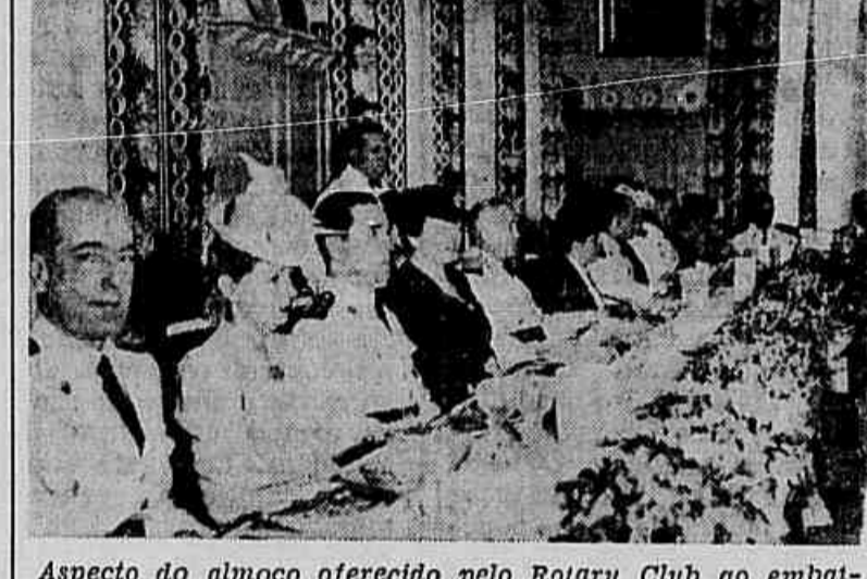
Aspecto do almoço oferecido pelo Rotary Club ao embaixador da França, general François d'Astier

Depois da União Soviética, foi o país que teve as mais elevadas perdas humanas — Os danos materiais alcançaram cifras enormes — No próximo mês chegarão ao Rio varias exposições de arte daquela nação amiga — Como falou, no Rotary Clube, o general François d'Astier de la Vigerie