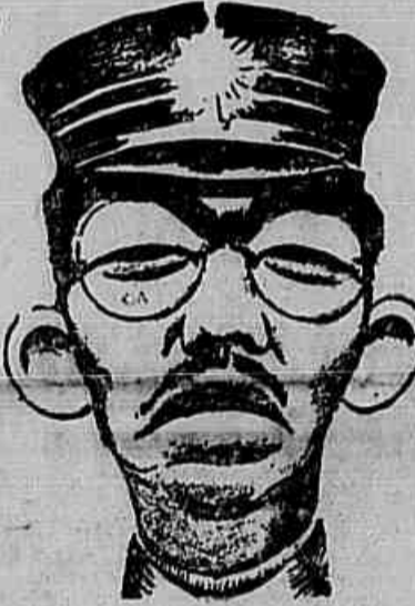
Hirohito, imperador do Japão

A Casa Branca, em Washington, indicou que a guerra continuaria, em terra, mar e ar, até que fosse oficialmente aceite o pedido de rendição. Londres também anunciou que havia sido dada ordem para que o país continuasse trabalhando como de costume, o que, em outras palavras, equivale a declarar que