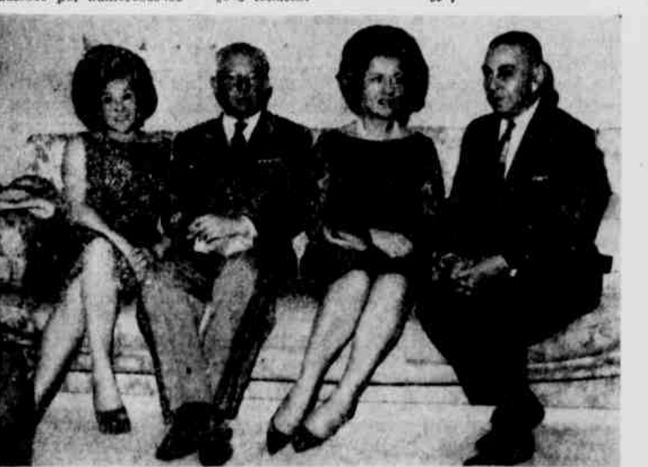
HOMENAGEM AO GEN. HUGO GARRASTAZU

Serão inaugurados, amanhã, os dois primeiros prédios construídos com a campanha do selo. Um será ocupado por uma família, numa das casas que foram, ficando a outra ocupada por cinco doentes. O segundo prédio servirá para oficinas de carpintaria. As obras foram iniciadas em 1957 e orçam-se a este mês a cerca de 30 milhões de cruzeiros. A obra terá o custo calculado em aproximadamente 500 milhões de cruzeiros.