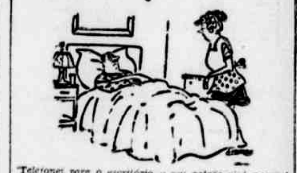
Telefone para o escritório e seu patrão virá pessoalmente tirar sua temperatura!

O médico foi franco: - O que o senhor precisa e acabar com essa mania de tomar remédio! O cliente aprovou a idéia: - O senhor tem razão! Me arranje um remédio bom para curar essa mania.