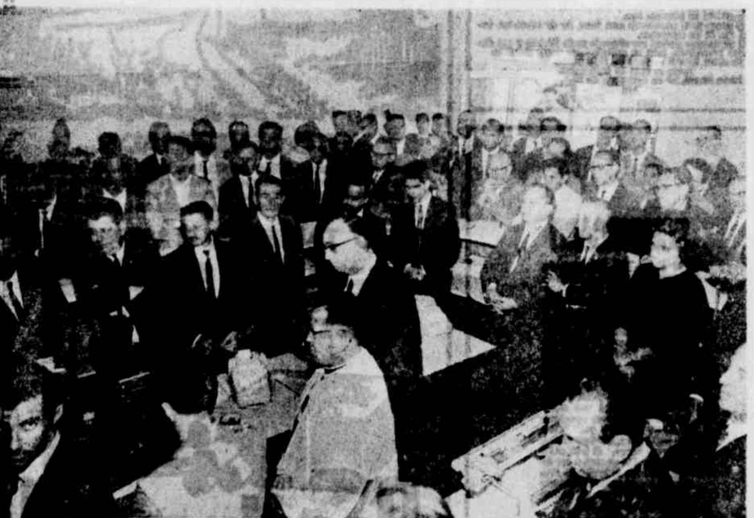
O Banco Industrial e Comercial do Sul S/A inaugurou dia 26 de novembro p.pdo. a sua 10.ª Agência Metropolitana nesta Capital.