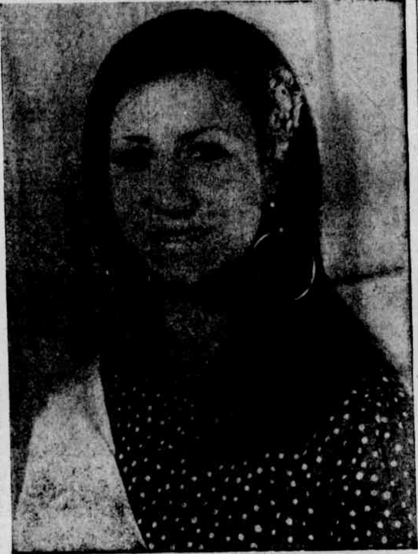
◆ Esta é a Est. Rala do CTG "David Canabarro" de Arroio dos Ratos. Ela é uma candidata do grande estylo e com qualidades de figurante muito bem, na final de Taquara, na próxima semana. Uma estampa de gaúcha autêntica e com conhecimentos de história e folclore, nos seus 19 anos de dedicação aos estudos. É normalista, na respectiva escola de São Jerônimo e prenda do Movimento Tradicionalista Gaúcho. Por todos os seus méritos e que a sociedade e gaúchos de seus países, confirmam em seu sucesso no concurso "A Mais Linda Prenda do RGS-67", promoção dos "Diários e Emissoras Associados" e Caixa Econômica Estadual.