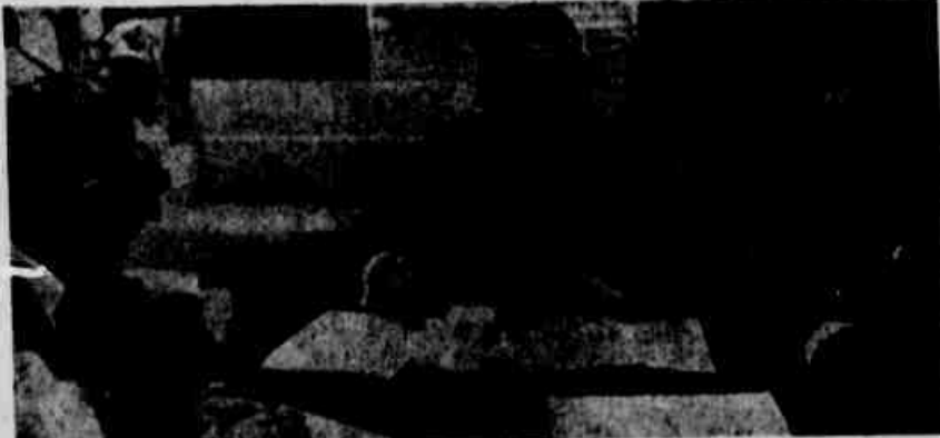
◆ Na SUDESUL, o general Georges Buchlet tratou do aproveitamento da casca do arroz no fabrico do tijolo.

A SUDESUL realizará um levantamento das possibilidades de instalação de uma usina, levando em conta os seguintes elementos: produção anual de arroz, distância em que estão localizados os moínhos, comunicações etc., de tal forma que consiga indicar a viabilidade econômica do projeto.