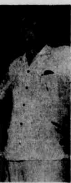
Quer "tratos limpos"