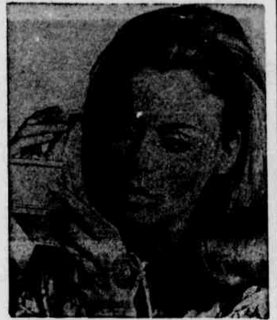
♦ Uma escovinha... gigante — traz cobertura para seus olhos — vem numa caixinha com máscara para os olhos e a prova de água... ou de lágrimas

Haverá algum truque especial para se aplicar essa máscara? Sim, use uma escovinha limpa. Escova malor dará mais jeito para cobrir toda a área a ser aplicada a máscara. Se está dando duas camadas às pestanas deixe a primeira secar antes de aplicar a outra. Guarde a mão uma outra escova, utilizando-as para separar as pestanas após cada aplicação da máscara.