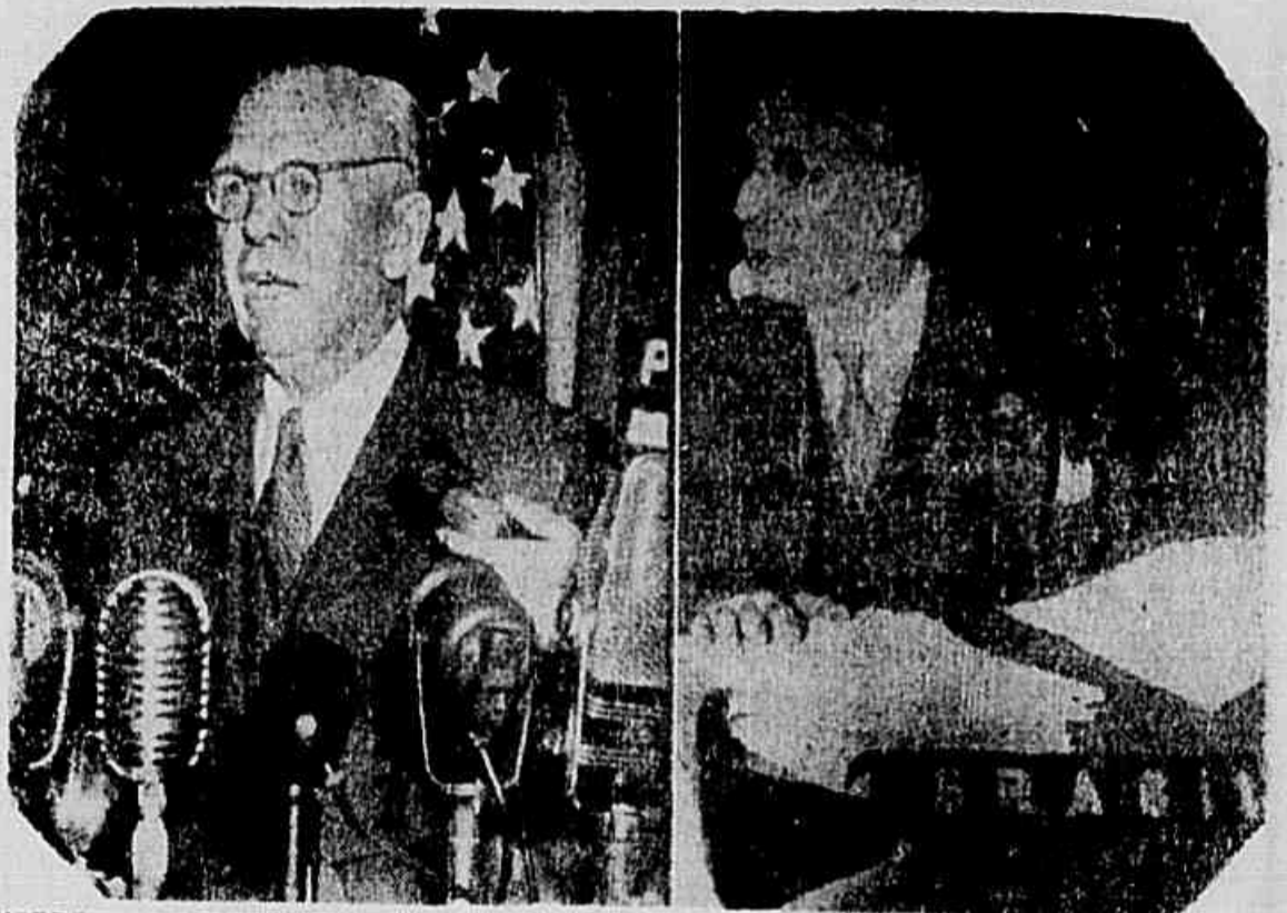
CONFERENCIA INTERAMERICANA — A' direita: o general George Marshall quando pronunciava o importante discurso, apelando para as diferentes delegações se em girem unicamente a discussão dos assuntos constantes na agenda da Conferência. A' esquerda: o deputado Prado Kelly, da delegação brasileira à Conferência Interamericana.

O excesso de matéria que há, todos os dias, neste jornal, nos obriga a transferir grande parte do noticiário do dia, até comentários, para as colunas de "A Tarde", onde o publico encontrará, portanto, os assuntos que poderia parecer haver escapado ao registro deste matutino, de que "A Tarde" é suplemento.