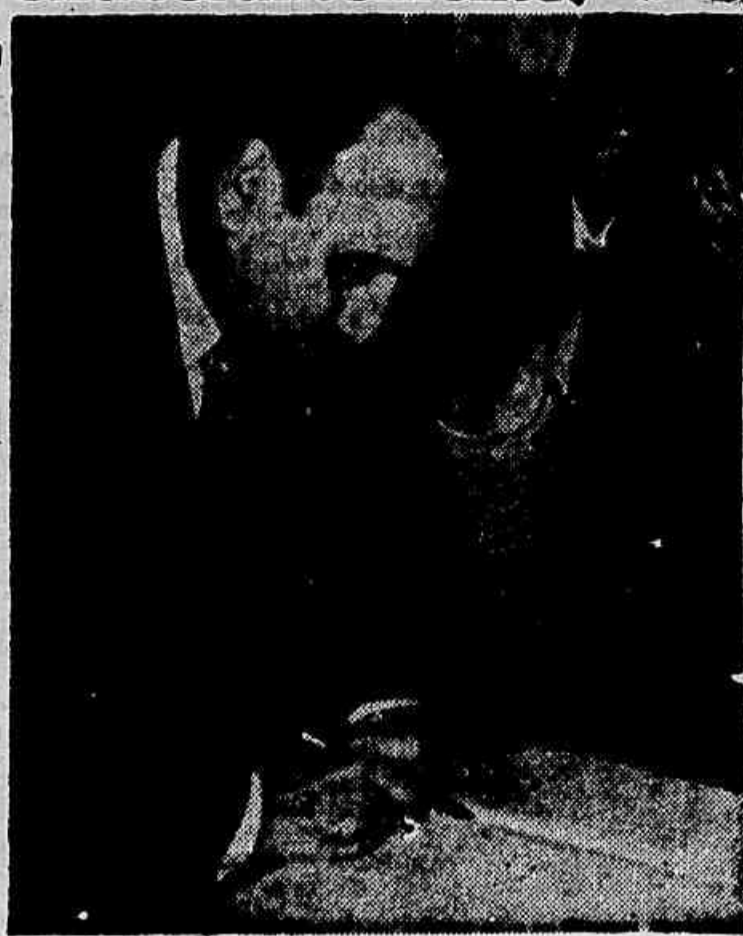
so existe no papel — O C.N.D., razão por que tudo corre frouzo