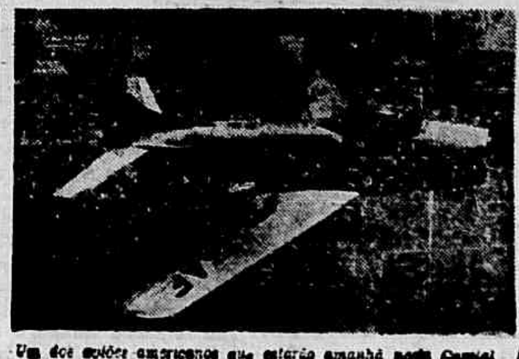
Um dos aviões americanos que estarão amanhã neste Capital