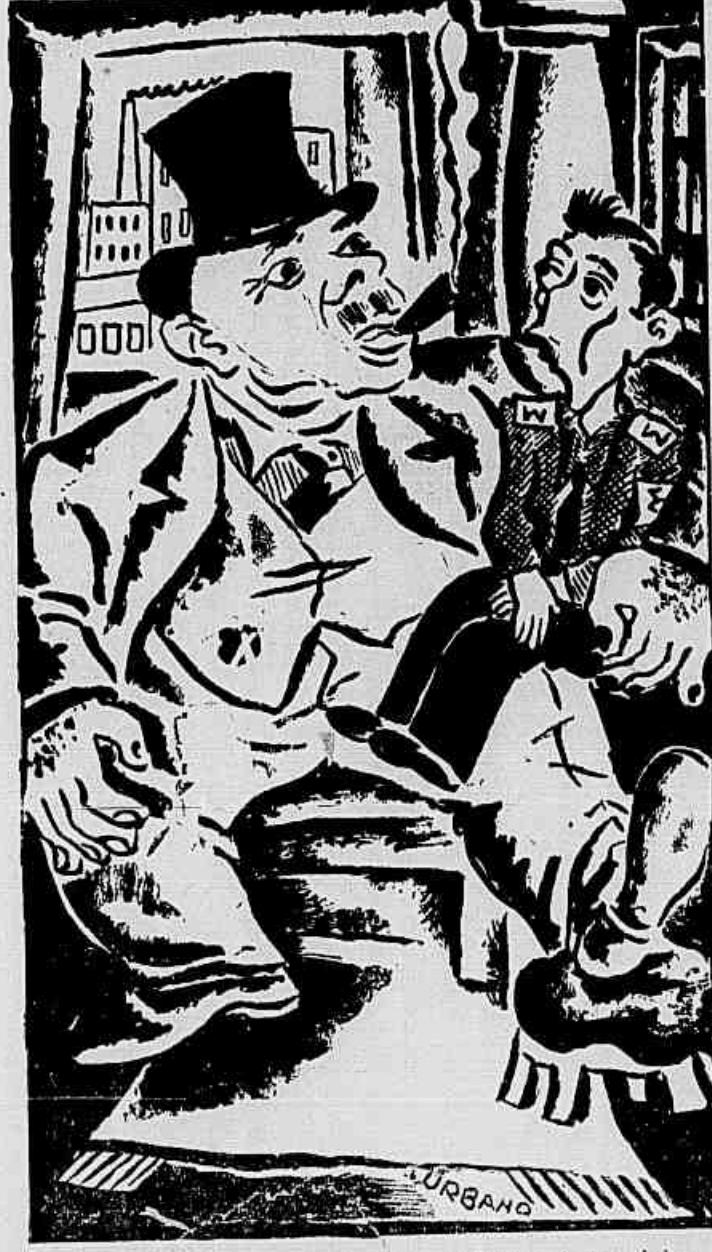
CARTOLA: — Eu tambem tenho um bonequinho.

leis do paiz, desrespeitando a situação privilegiada dos inermes em nossa legislação e desrespeitando, principalmente, todos os sentimentos de humanidade.