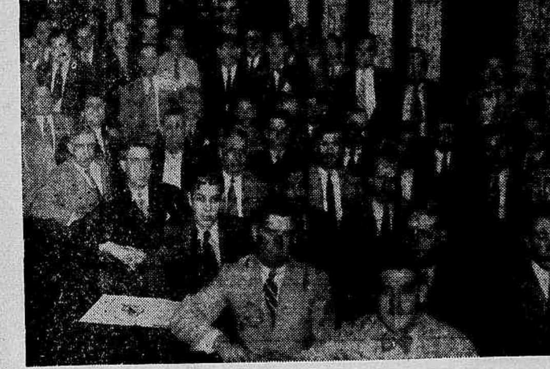
A sessão de hontem, dos açouqueiros

Querem a extincção da Commissão de Tabellamento e a redução dos impostos — A sessão de hontem, á noite