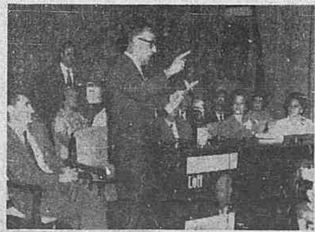
Aspecto da solenidade, quando falava o Dr. Gabriel Pedro Moacir, antigo prefeito da capital gaúcha