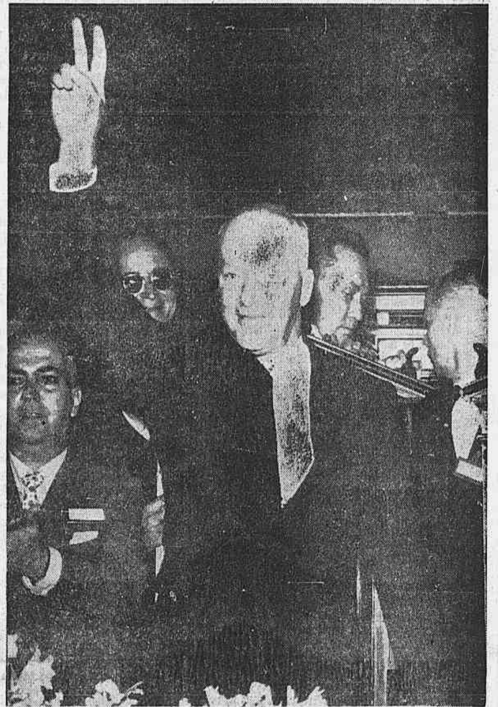
Lott, na Convenção do P.S.D. faz o V da vitória

Na primeira sessão ordinária do Congresso, realizada na manhã do dia 2, o secretário deu a palavra ao representante do governador Carvalho Pinto, de São Paulo. O homem puxou um catau. Era uma mensagem de C.P. que ele começou a ler. Os congressistas ouviam pacientemente a mensagem de Carvalho Pinto, quando, num dado momento, o seu leitor tropeçou com um elogio a Jânio Quadros. Foi o bastante para que a assistência prorrompesse numa vaia estrondosa. No dia seguinte 3, o secretário procedia à leitura do expediente, quando deu conhecimento à casa de uma saudação ao Congresso enviada pelo marechal Teixeira Lott. Verificou-se, então, cena inversa da ocorrida na véspera: de pé, a assistência rompeu em aclamações entusiasmadas ao nome do Candidato Nacionalista. Tanto a vaia em Jânio como a consagração ao Marechal foram testemunhadas pelo deputado federal Nélio Ramos, do PR da Bahia, que participou do Congresso do Recife.