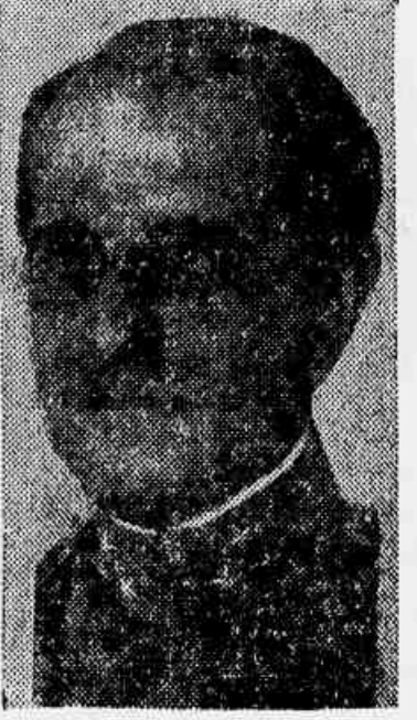
O GENERAL TASSO FRAGOSO

A JUNTA PACIFICADORA QUE TÃO BONS SERVIÇOS PRESTOU AO PAIZ, ADMINISTRANDO-O NO PERIODO COMPREENDIDO ENTRE 24 DE OUTUBRO E 3 DE NOVEMBRO, DATA EM QUE O ENTRFGOU AO SR. GETULIO VARGAS, TEM RECUSADO, ATE' AGORA, SYSTEMATICAMENTE, TODAS AS HOMENAGENS QUE SE LHE VEM PROPONDO. DESISTIRAM DE ESTATUAS, DE BANQUETES, DE MANIFESTAÇÕES POPULARES, DE TUDO O QUE LHES PODERIA TESTEMUNHAR O RECONHECIMENTO DOS DIRIGENTES REVOLUCIONARIOS E A GRATIDÃO DO PAIZ.