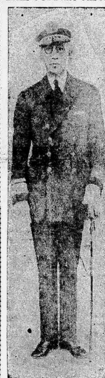
O ALMIRANTE ISAIAS DE NORONHA

A JUNTA PACIFICADORA QUE TÃO BONS SERVIÇOS PRESTOU AO PAIZ, ADMINISTRANDO-O NO PERIODO COMPREENDIDO ENTRE 24 DE OUTUBRO E 3 DE NOVEMBRO, DATA EM QUE O ENTRFGOU AO SR. GETULIO VARGAS, TEM RECUSADO, ATE' AGORA, SYSTEMATICAMENTE, TODAS AS HOMENAGENS QUE SE LHE VEM PROPONDO. DESISTIRAM DE ESTATUAS, DE BANQUETES, DE MANIFESTAÇÕES POPULARES, DE TUDO O QUE LHES PODERIA TESTEMUNHAR O RECONHECIMENTO DOS DIRIGENTES REVOLUCIONARIOS E A GRATIDÃO DO PAIZ.