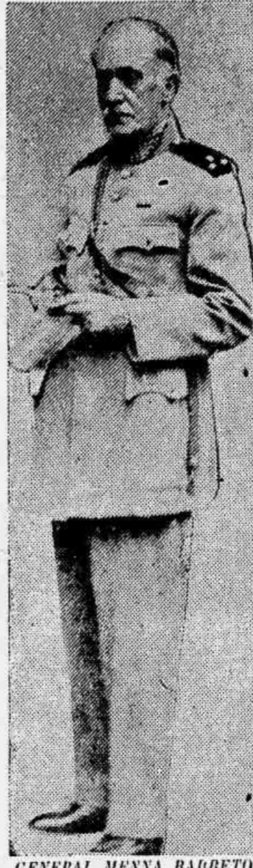
GENERAL MENNA BARRETO

Os srs. Tasso Fragoso e Menna Barreto serão feitos "Marechaes do Brasil" E o sr. Isaias de Noronha será promovido ao posto de Almirante, creado especialmente para esse fim