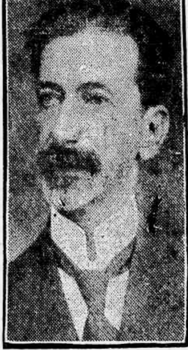
SR. DR. BORGES DE MEDEIROS

O que corre, a respeito, nos meios judicarios - Um telegramma do sr. Borges de Medeiros ao sr. Getulio Vargas?