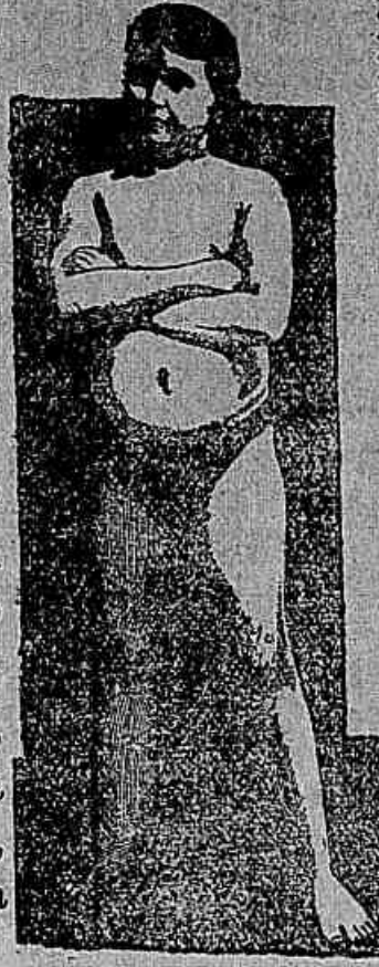
EDADE 11 ANNOS

A transformação maravilhosa de um ser debil e rachítico n'um adolescente forte, robusto e sadio, como o demonstra sua atheletica figura, foi obra realizada pela