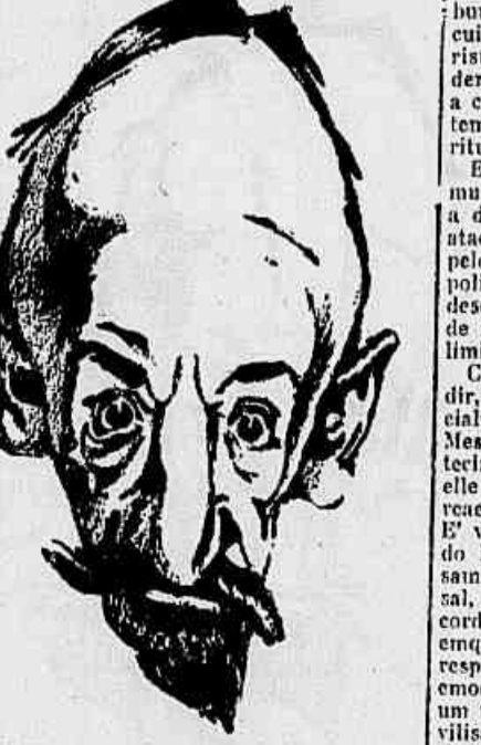
Tchecherini, um dos controladores da expansão comunista

Em qualquer situação, o trabalho do communismo é preparar a confusão, estabelecer a desordem, a confusão que lhe permite os ataques indirectos á estabilidade nacional pelo combate aos elementos de equilibrio politico e de coordenação economica, — a desordem que, a seguir, lhe faculte o golpe de força em complemento da campanha golpista.