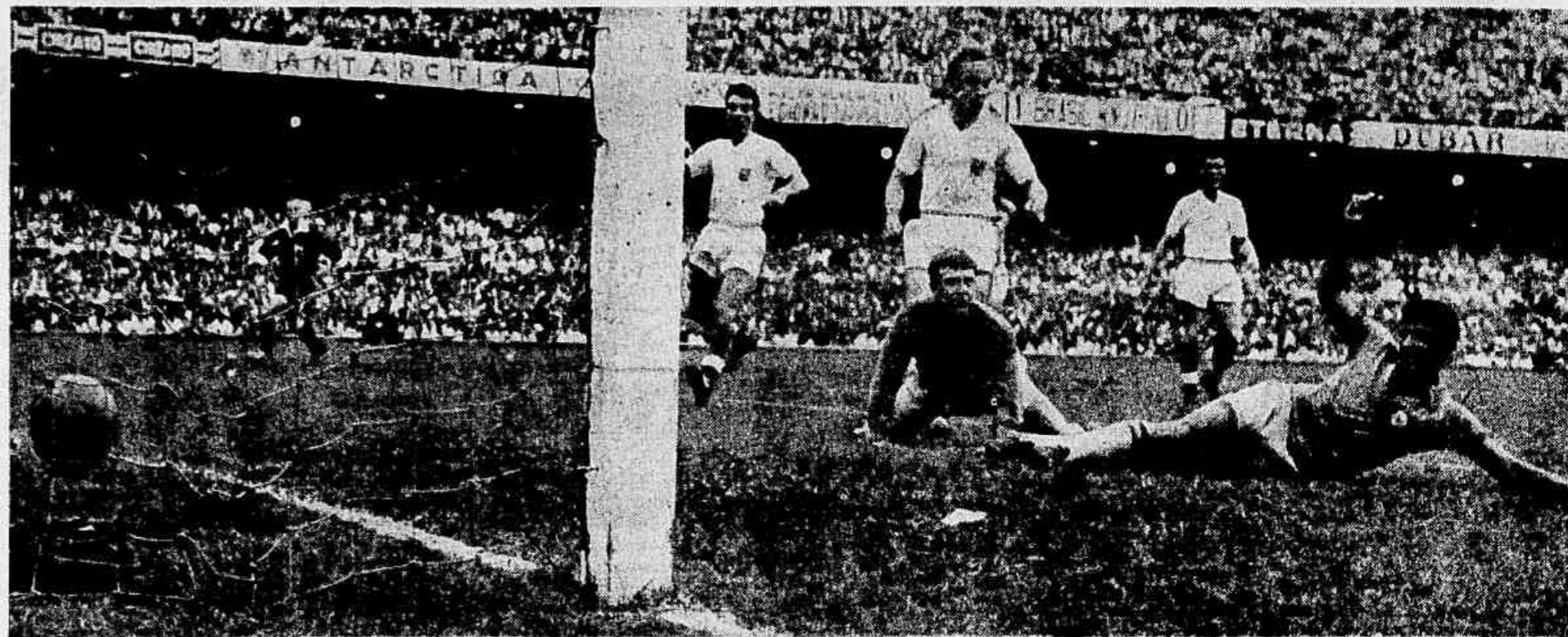
Em três jogos disputados, o Brasil perdeu o primeiro, em Londres, por quatro a dois, empatou o segundo, no "Mundial" da Suécia por zero a zero, e ganhou o terceiro, no Maracanã, por dois a zero, um dos gols como se vê na foto. Os adversários de amanhã estão iguais em tudo, portanto. Só que o triunfo, ou a "negra", agora, poderá valer a conquista da "Copa-62".

— MAIS UMA DESSAS, E ELE ACABA OUTRA VEZ CHEFE DE POLICIA NESSE GOVERNO.