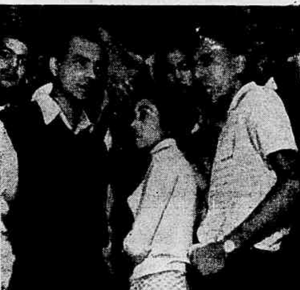
Amanhã, mais dez anos de vida em 90 minutos de agonia.

Realmente, o Governo da Venezuela está tão firme, mas tão firme, que esmagou uma revolução cada duas horas.