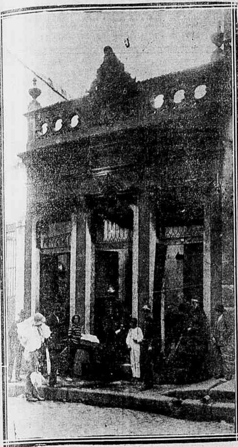
2 prédio n. 164 da rua Barão de S. Felix, destruído pelo fogo na madrugada de hontem.