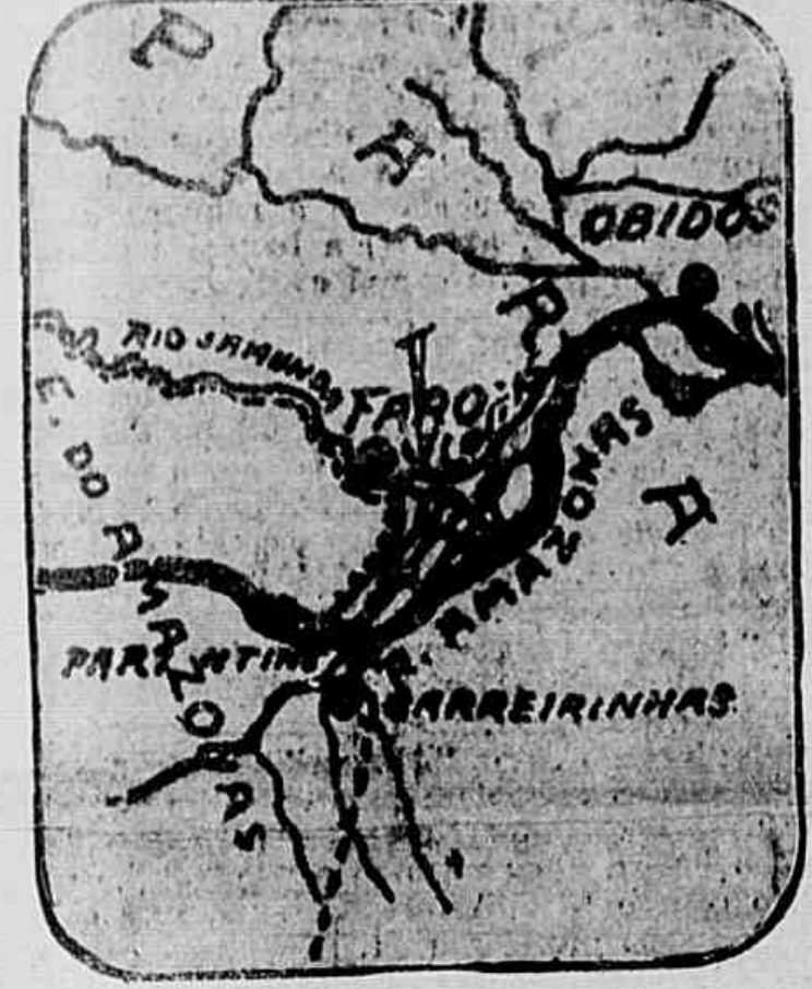
MAPA DA REGIÃO LITIGIOSA