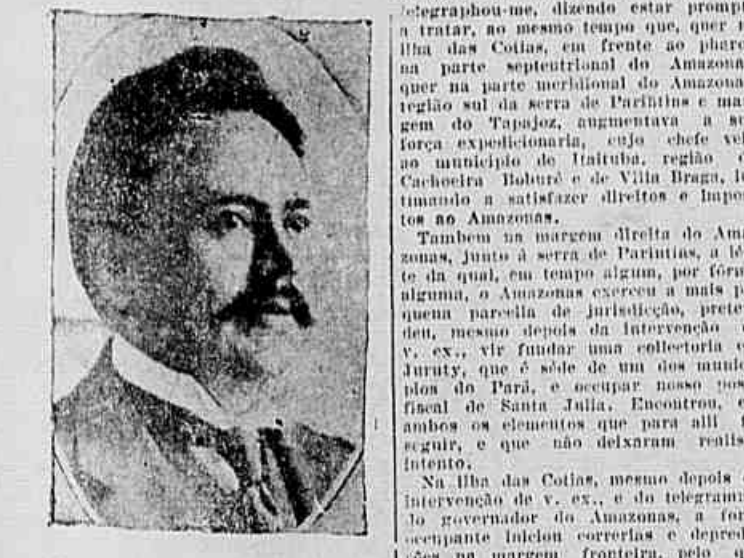
Eudés Martins, governador do Pará

desaparecer em meio a uma grande colônia, com o seu bello gesto de «trabalhar», podendo também hostilizar os productos nacionaes. Esta affirmação ignobil deve desaparecer quanto antes. A colônia portugueza, no contrario do que tendenciosamente se quer fazer acreditar, é a maior propagandista e amiga das coisas brasileiras e dos brazileiros. Agora mesmo essa amizade se está