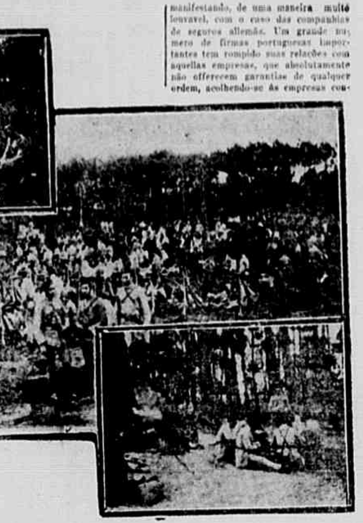
Exercícios do Exército Português — Aspecto de um bivac

manifestando, de uma maneira muito novavel, com o caso das companhias de seguros allemãs. Um grande numero de firmas portuguezas importantes tem rompido suas relações com aquellas empresas, que absolutamente não offerecem garantias de qualquer ordem, acobardando-se as empresas con- Na serra de Monsanto realizaram-se em honra do Kaiser, exercicios de artilharia. As baterias puzadas a munição venceram os obstaculos naturaes com facilidade, mas uma delas, ao atravessar um vallado, enovelou-se desastrosamente, cahindo tudo, de roldão, no fundo do fosso, desaparecendo das vistas dos soberanos. — Já se não levantam!... disse o Kaiser. — Levantam, sim, respondeu o Rei. E, de facto, a bateria desvencilhou-se e appareceu, de repente, no cimo do vallado, para continuar o galope, na campina, a juntar-se ás outras. Podéramos citar ainda, como instituição modelar no genero, a Manutenção Militar, onde se fabrica todo o pão necessario ao exercito e que, trabalhando em silencio, pôde abastecer a população inteira de Portugal. A. V. —