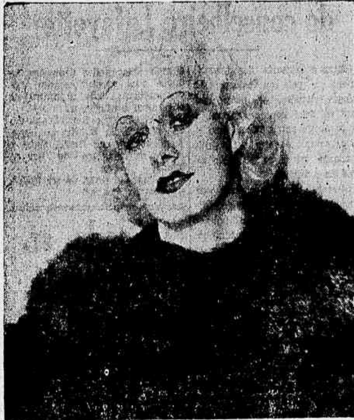
JEAN HARLOW, a grande interprete da Metro num filme deslumbrante "MILE DYNAMITE", que será levado á tela do luxuoso Cine Paramount segunda-feira

JEAN HARLOW E' A "MILE DYNAMITE" QUE O CINE PARAMOUNT APRESENTA 2.-FEIRA