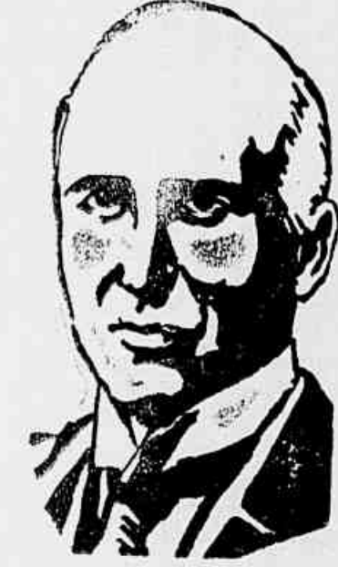
Sr. ARTHUR HENDERSON

O governo britannico, segundo affirmam os circulos autorizados, teria preferido que fosse marcado prazo mais afastado afim de permittir o proseguimento das conversações correntes. O sr. Henderson, entretanto, allegou que não tinha poderes para adiar a data da convocação. Entretanto, os governos de Londres e de Paris proseguirão nas trocas de vista sobre os problemas das garantias.