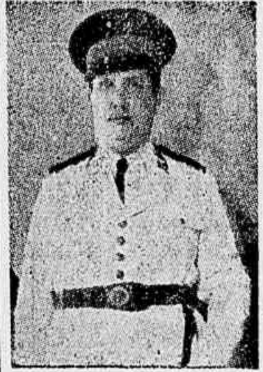
O general GO'ES MONTEIRO, ministro da Guerra

um novo projecto de Constituição, que seria apresentado ao plenário como se fosse uma emenda ao substitutivo da Commissão dos 26. Esse novissimo projecto estaria