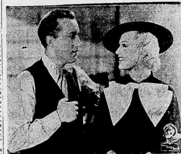
Marion Davies e Bing Crosby numa maravilhosa scena da superpellicula da Metro-Goldwyn "Delirio de Hollywood", que o Cine Paramount apresentará segunda-feira aos seus "fans"

No Cine Paramount, o cinema de São Paulo chic e elegante, teremos, 2.a feira proxima uma nova estréia de Metro Goldwyn Mayer. "Delirio de Hollywood". E essa maravilhosa estréia que o publico assistirá enbrado com o luxo e a montagem que o filme apresenta.