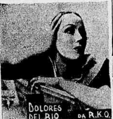
Em "Voando para o Rio" Dolores, a linda Dolores, irá apaixonar todos os seus "fans". O "Broadway-Programma" nos mostrará em breve o maior filme do anno.