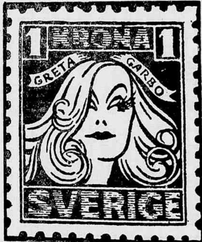
Cliché de um dos sellos com a figura de Greta Garbo, postos em circulação pelo governo da Suecia

JA' CIRCULAM, NA SUECIA, SELLOS POSTAES COM A EFFIGIE DE GRETA GARBO