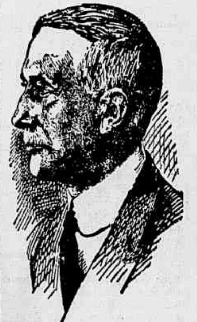
Sr. ANTONIO CARLOS

RIO, 22 (H.) — No gabinete do sr. Oswaldo Aranha, ministro da Fazenda, estiveram hontem conferenciando com s. exa. os srs. general Góes Monteiro, ministro da Guerra, almirante Protogenes, ministro da Marinha, dr. Armando de Salles Oliveira, interventor em S. Paulo, capitão Carneiro de Mendonça, interventor federal no Ceará, deputado Augusto Simões Lopes, lider da bancada do Rio Grande do Sul a Assembléa Nacional, e deputado João Alberto.