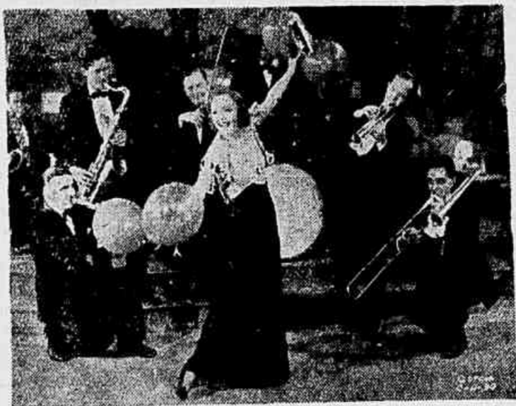
Nancy Carroll numa scena do filme "Anjo de Nova York" que o Rosario apresentará segunda-feira

Com John Boles, Nancy Carroll chegará segunda-feira em "Anjo de Nova York", o filme Columbia que o Rosario estreará nesse dia