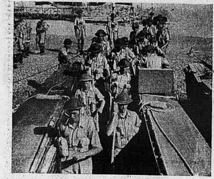
Tropas aliadas em operação na Itália

Banco da Lavoura de Minas Gerais S/A Empréstimos-Depósitos-Cobranças UBERABA — AGENCIA Rua Artur Machado, 37 fone — 1973