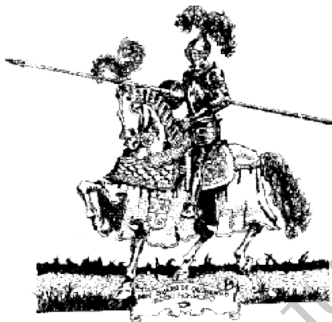
F3. Caballero preparado