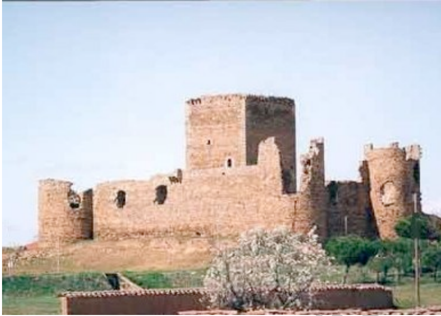
F4. Restos del castillo de D. Suero en Valdejamuz

Según las crónicas, el día del inicio de los combates, los allí asistentes pudieron ser testigos de cómo D.Suero: “Salió en un caballo fuerte, con paramentos azules bordados de la devisa e fierro de su famosa empresa (...) Sus calzas eran de grana, italianas, y una caperuza alta de grana, con espuelas de rodete italianas, ricas, doradas, en la mano una espada de armas desnuda dorada. Llevaba en el brazo derecho, cerca de los morcillos, su empresa de oro, ricamente obrada, tan ancha como dos dedos, con letras azules alrededor, que decían: Si a vos no place tener mesura yo digo: sin ventura”.