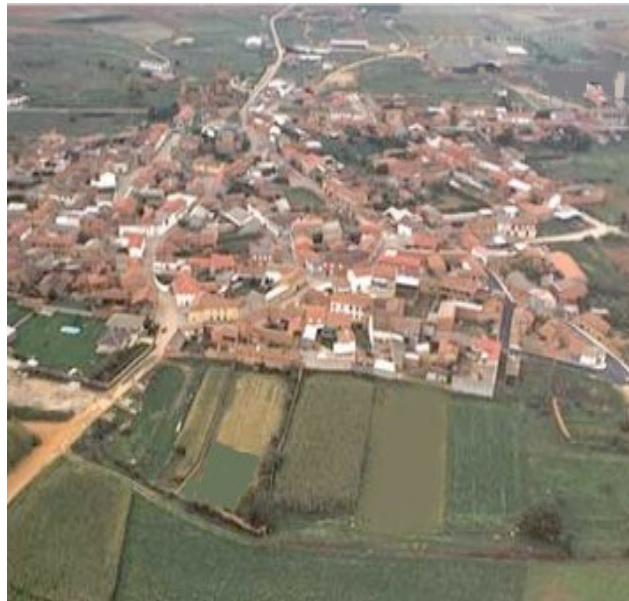
F5. Villanueva de Jamuz, cerca del Órbigo