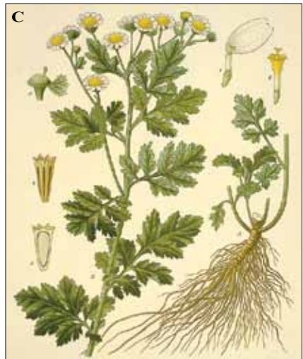
Fig. 32. Tanacetum parthenium . A. Detalle del capítulo. B. Capítulos. C. Ilustración (Köhler, 1887).