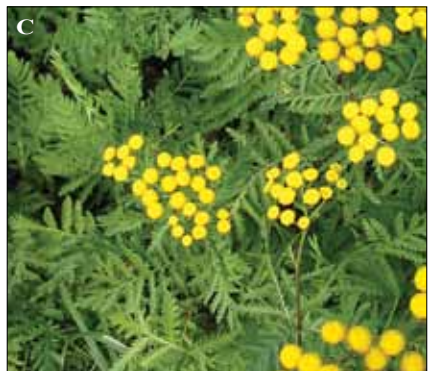
Fig. 33. Tanacetum vulgare . A. Detalle de los capítulos. B. Ilustración (Lindman, 1917). C. Aspecto de las plantas.