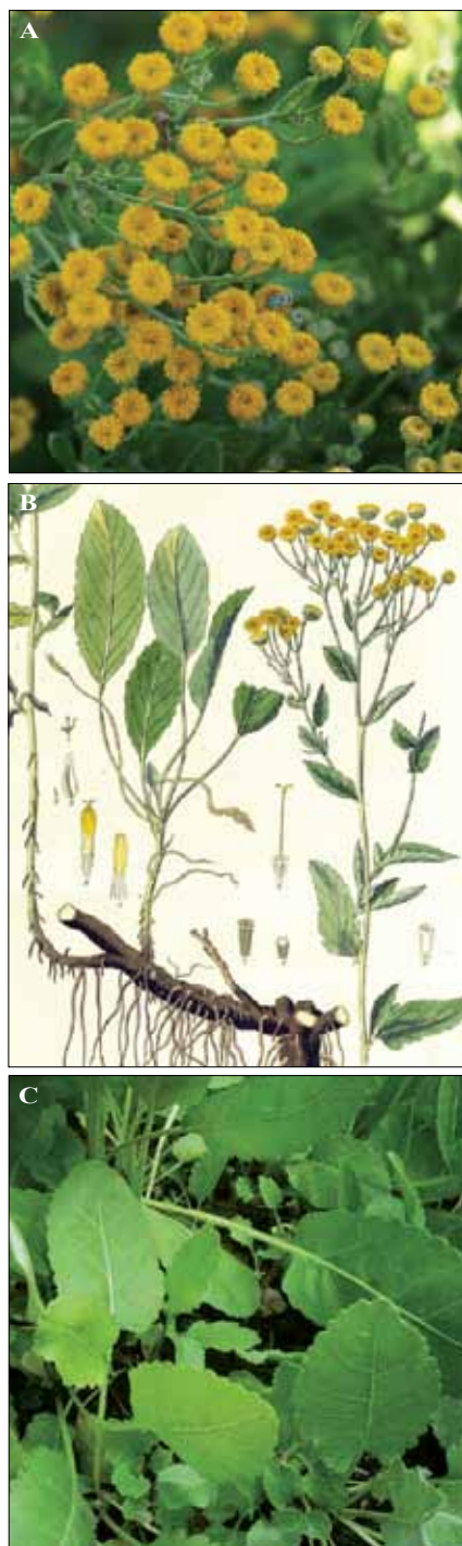
Fig. 31. Tanacetum balsamita . A. Aspecto de los capítulos. B. Ilustración (Hayne, 1809). C. Detalle de las hojas.

Iconografía: PLENCK, 1803: tab. 612; HAYNE, 1809: tab. 5; BRITTON & BROWN, 1913: 519.