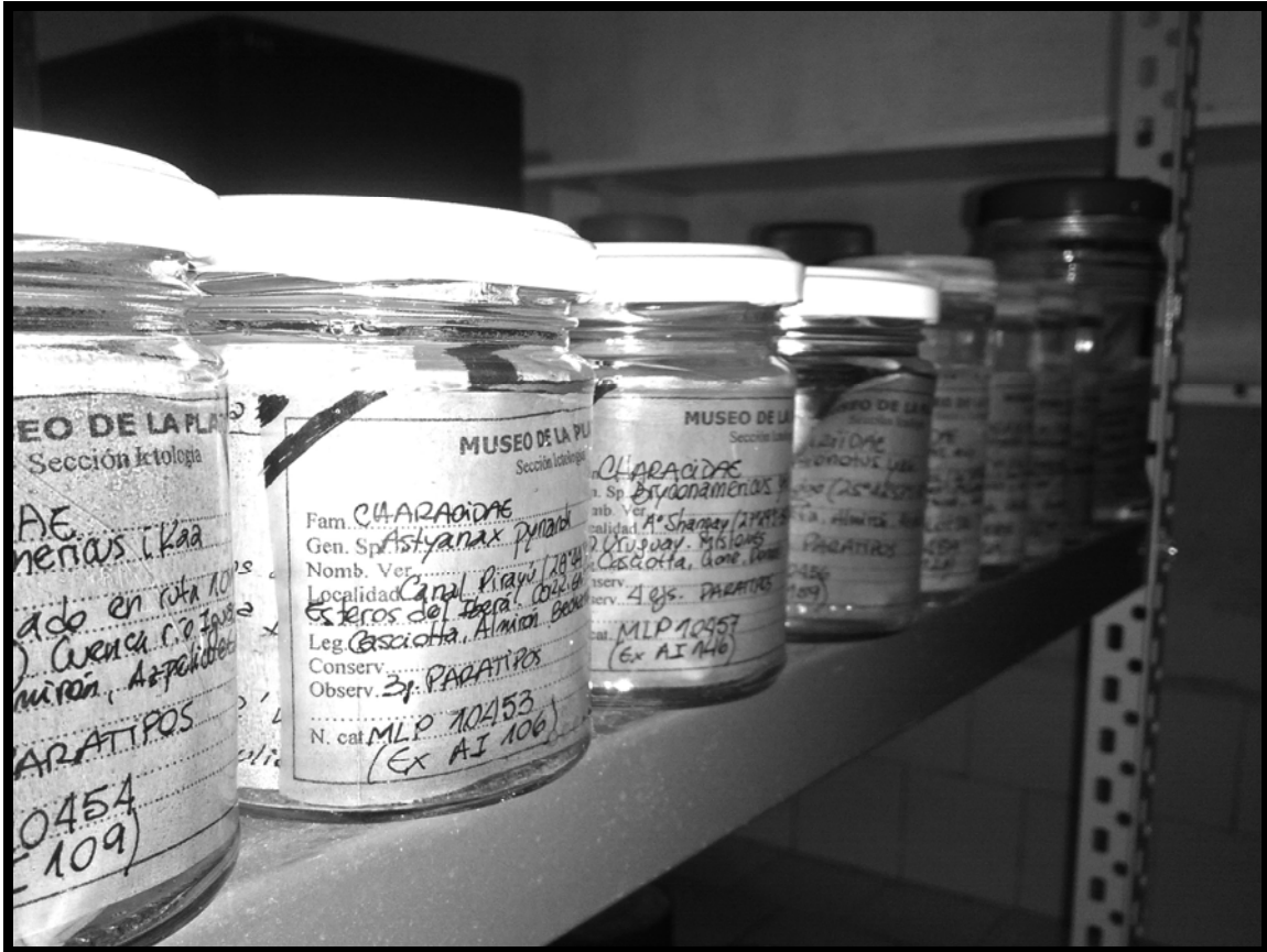
LOTES DEPOSITADOS EN LA COLECCIÓN DE TIPOS DEL MLP