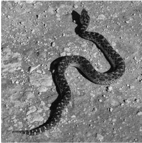
Figura 7. Bothrops ammodytoides .