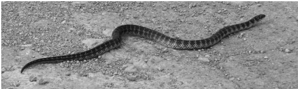
Figura 5. Erythrolamprus poecilogyrus .