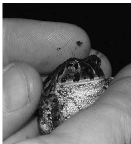
Figura 3. Dos especies de anfibios comunes en dunas: a la izquierda, Hypsiboas pulchellus . Derecha, Odontophrynus americanus .