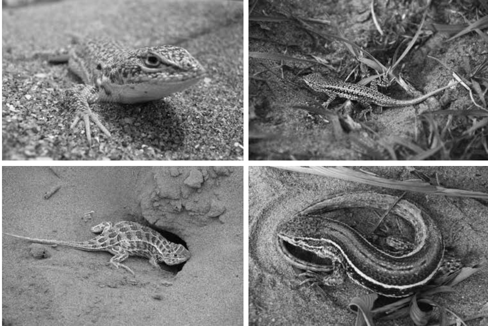
Figura 4. Lagartijas arenícolas típicas de las dunas bonaerenses. Arriba izquierda, Liolaemus multimaculatus . Foto: F. Kacoliris; abajo izquierda, Stenocercus pectinatus . Foto: J. Williams; arriba y abajo derecha, Liolaemus wiegmanni y Liolaemus gracilis respectivamente. Fotos: C. Abdala.