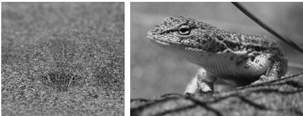
Figura 2. Especie amenazada de la herpetofauna de las dunas bonaerenses: Liolaemus multimaculatus .

La situación es muy delicada en general para toda la biodiversidad de anfibios y reptiles que habitan en dunas, y de seguir por este camino es altamente probable que en un corto plazo de tiempo, con la pérdida de grandes áreas costeras, se produzca la consecuente extinción de poblaciones locales de varias especies, principalmente de aquellas especializadas a la vida en la arena, como algunas lagartijas y culebras arenícolas. Sin embargo, aún quedan esperanzas de que políticas integradoras, e iniciativas orientadas a la creación y manejo de nuevas áreas protegidas, promuevan la generación de santuarios en donde se protejan los ensambles de anfibios y reptiles de la fauna costera autóctona.