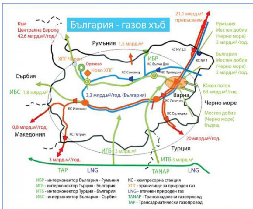
Слика 1. Интерконектор гасовода између Бугарске и Румуније, Грчке и Србије.

пуштена у рад 1. октобра 2022. године 15 , а отварање гасовода „Нови Искар-Ниш“ је одложено до краја 2023. године. 16