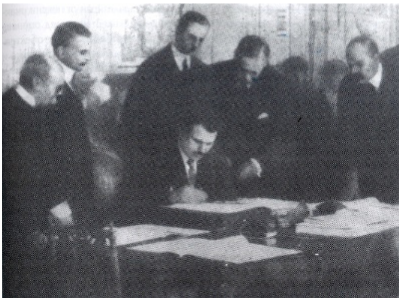
Стамболијски потписује Нејски споразум.