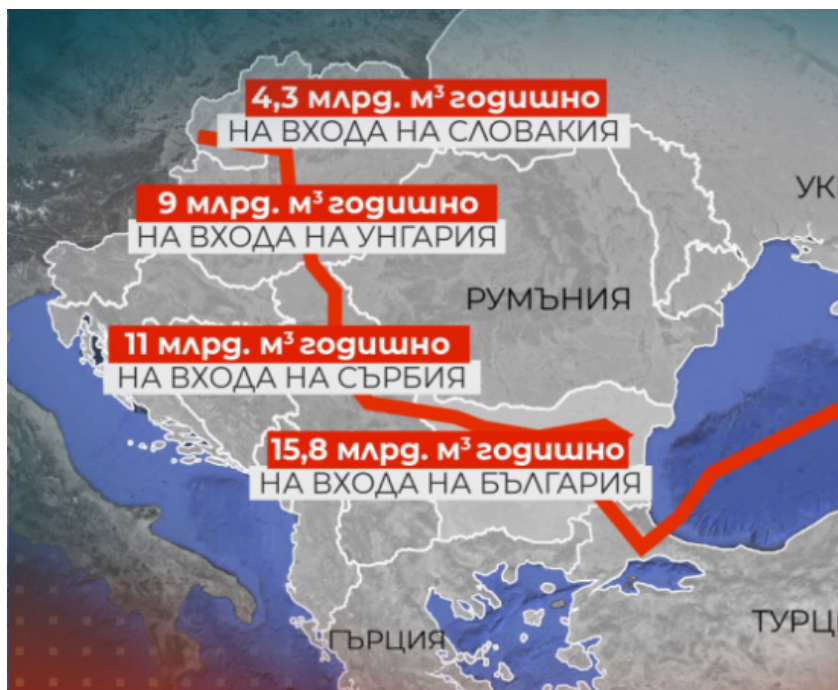
Слика 2. Гасовод Балкански ток