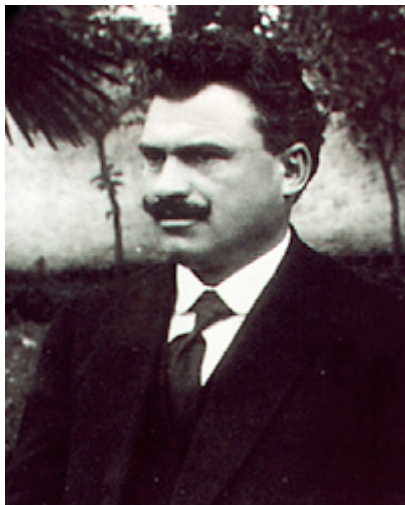
ФОТО: Александар Стамболијски.