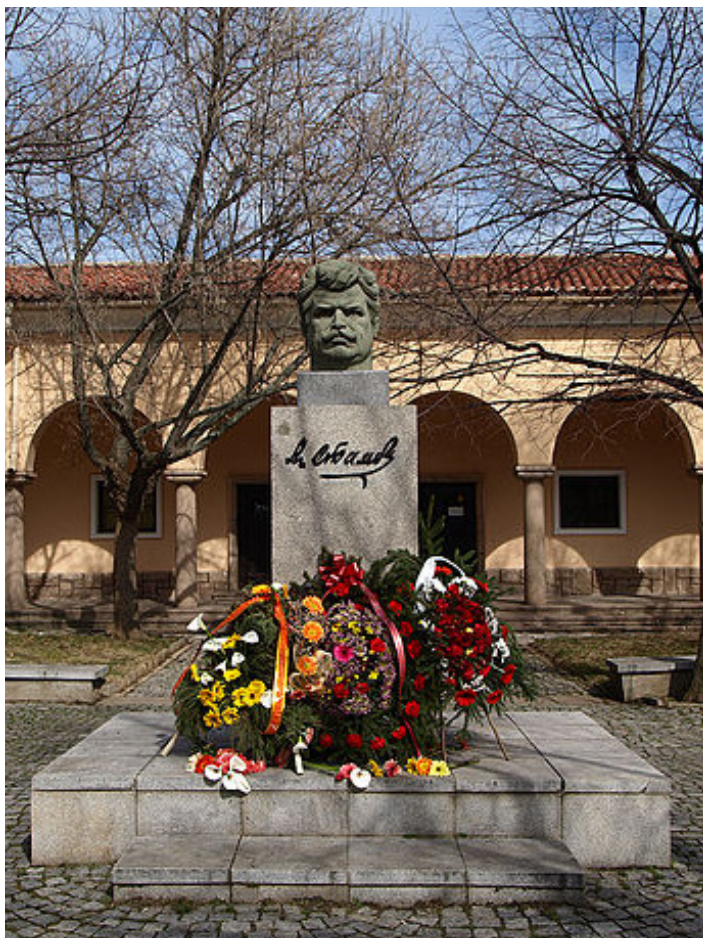
Споменик Стамболијском у Славовици.

У својој политичкој делатности борио се против бугарског учешћа на страни Немачке у Првом светском рату, због чега је ухапшен и затворен. Подржавао је идеју Балканске федерације и није се изјашњавао као Бугарин, већ као Југословен. „Што се тиче балканских суседа, Стамболијски је желео да најпре успостави пријатељске односе са свима. После тога је предвиђао да се, уколико буде било могуће, оснује јужнословенска федерација у коју би ушле Југославија и Бугарска, или чак и федерација свих балканских држава.” 10